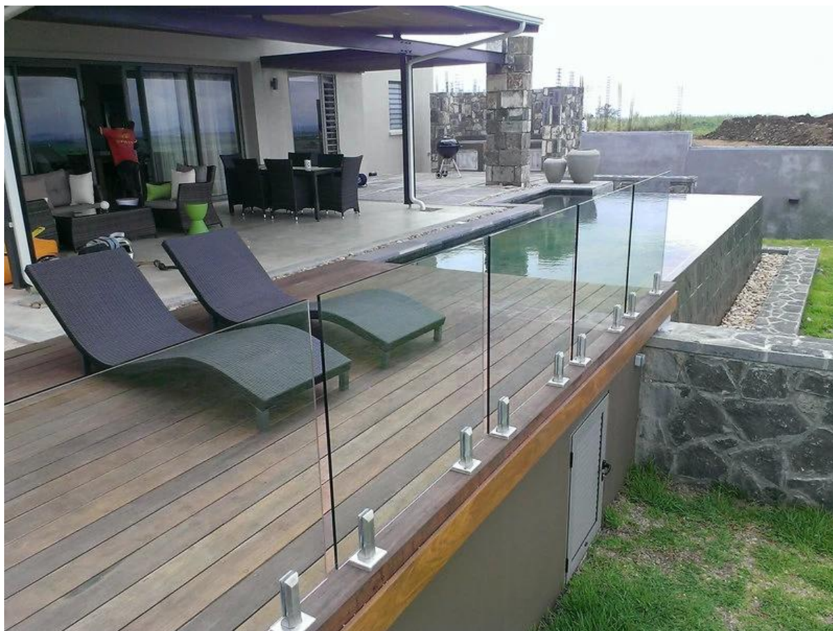
Terrasse et balcon ;