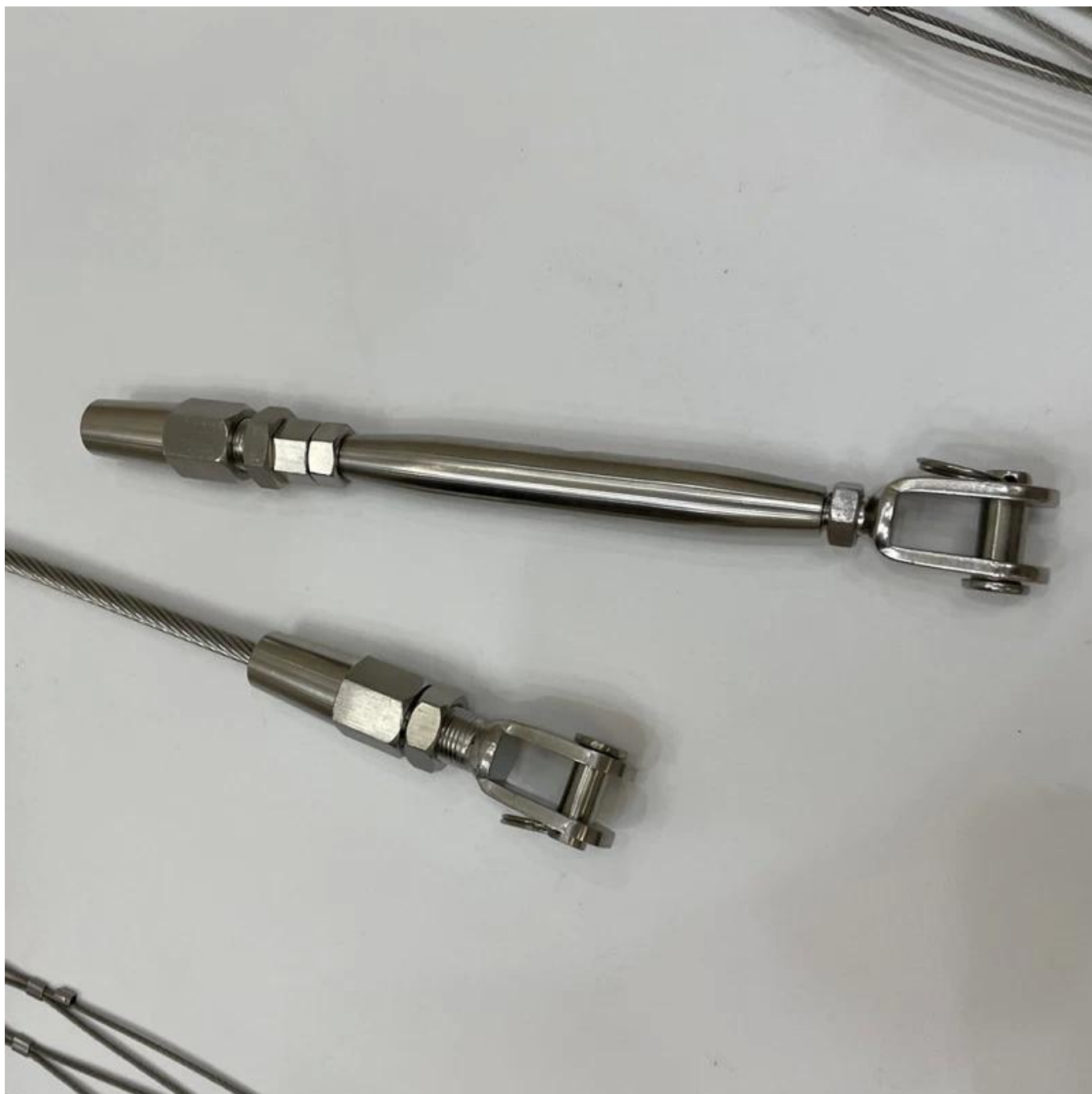
Test de fil de câble de 8 mm sur le tendeur -