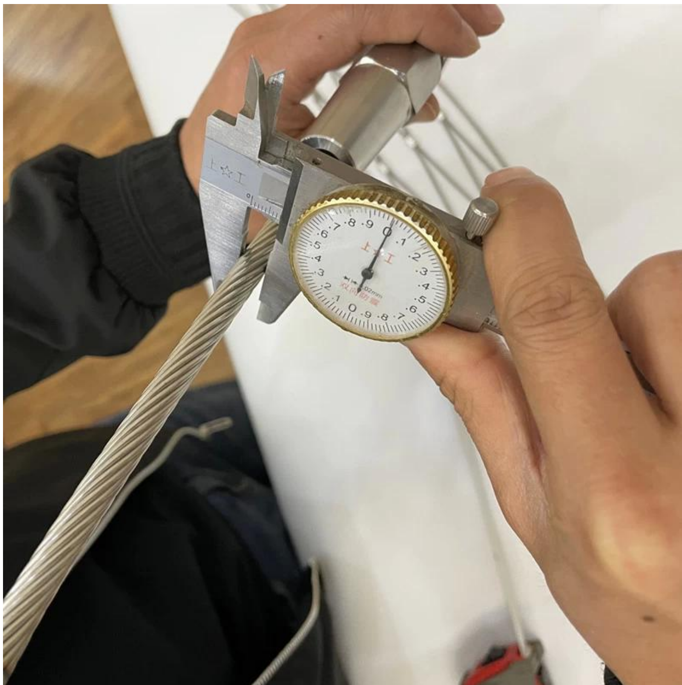
Production de masse de tendeur de fil de câble de câble de type oscille en acier inoxydable -