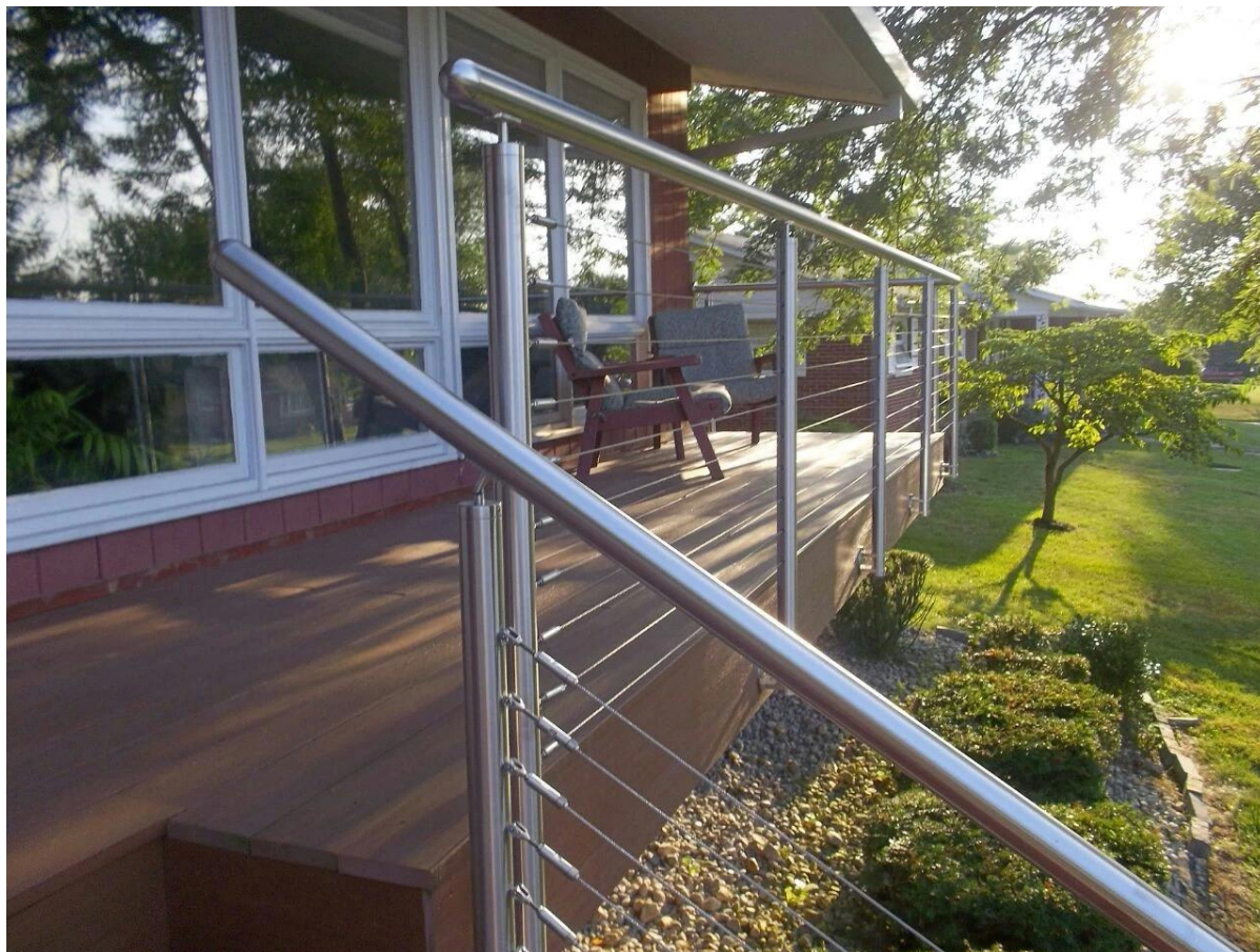
3mm, raccords 4mm, 5mm fil fin de corde, embouts de câble pour les poteaux de la rampe