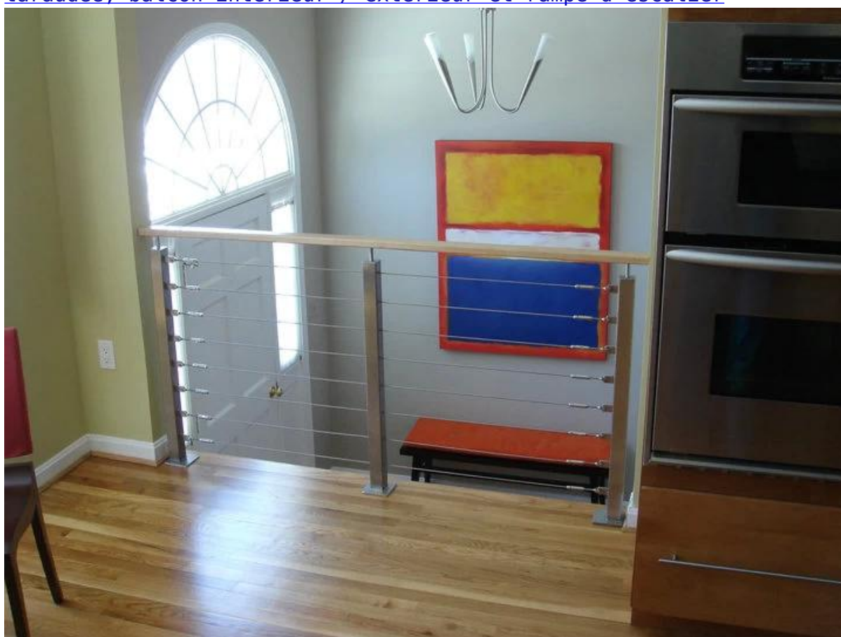
embouts de câble en acier inoxydable, tenseurs de câbles, tendeurs à câble