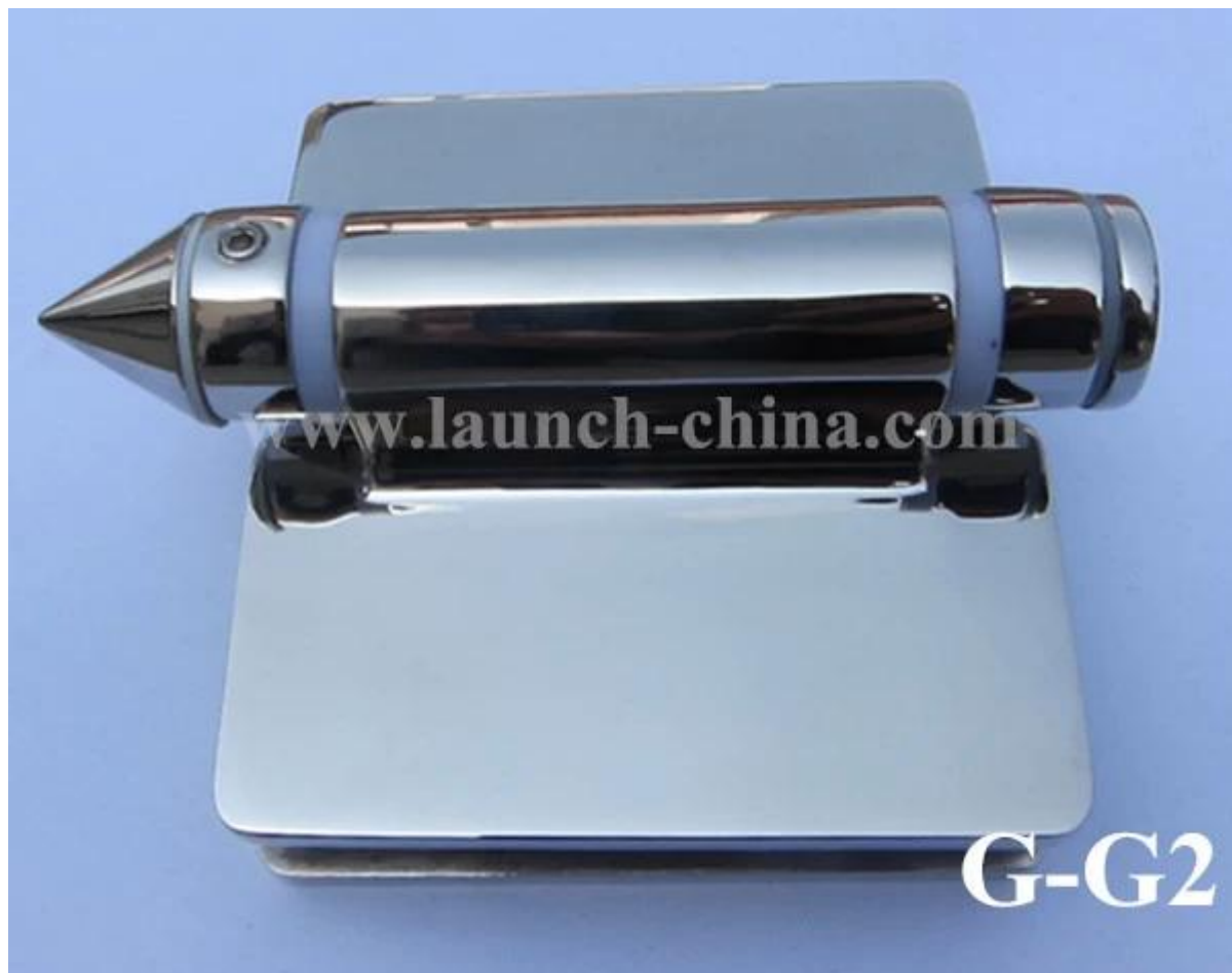
Verre à la post charnière ronde