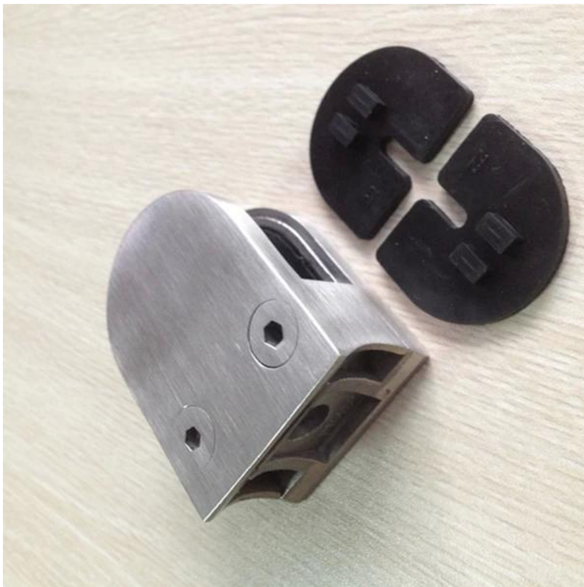
2.square collier de verre de forme à fond plat et à fond rond acier inoxydable de type carré collier de verre pour escalier, inoxydable collier de verre et d'acier à fond plat pour balcon main courante