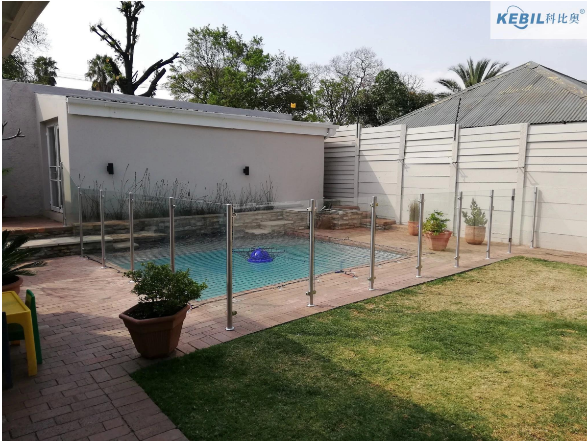
Conceptions de garde-corps en verre en acier inoxydable pour escalier