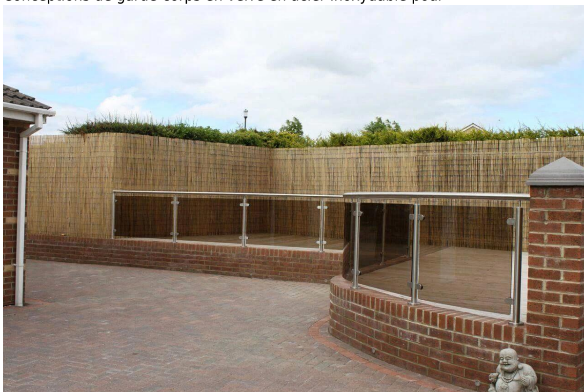
Poteau en verre pour conceptions de garde-corps en acier inoxydable -