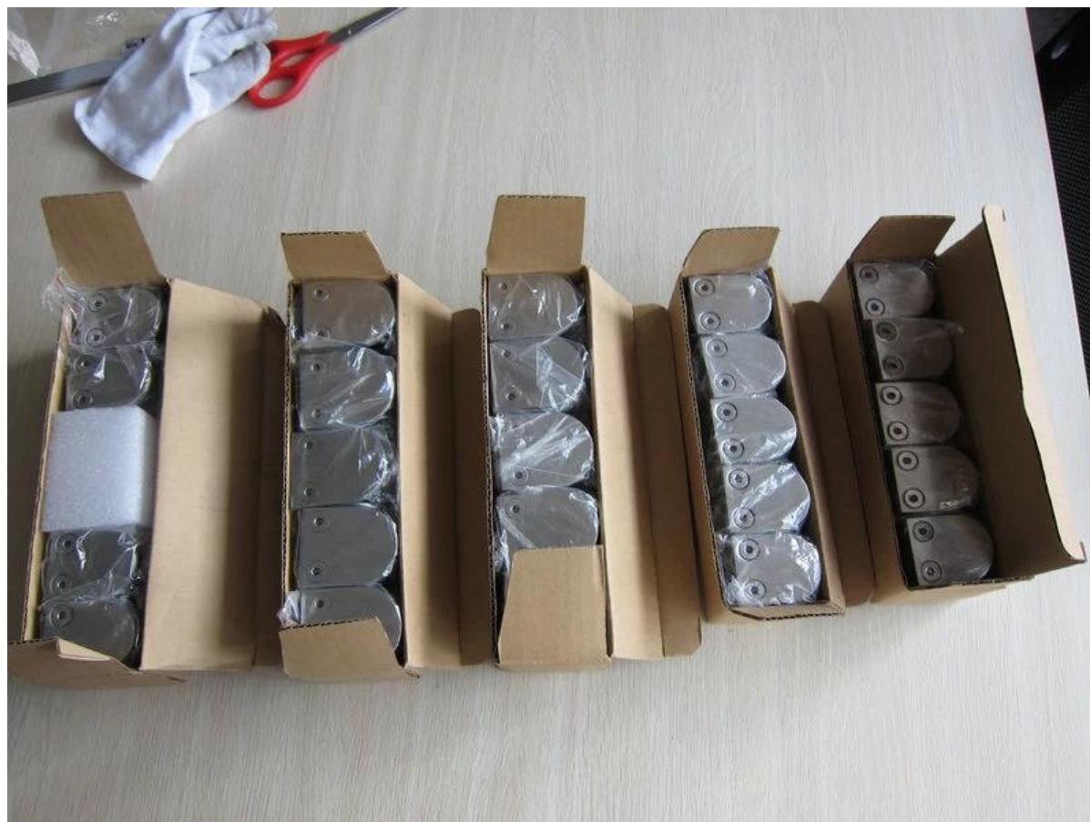
photo fo emballager acier inoxydable rampe verre serrer

Détails d'emballage: 1 pc dans un sac en plastique, 10 pcs dans une petite boîte, 100 pcs dans un carton