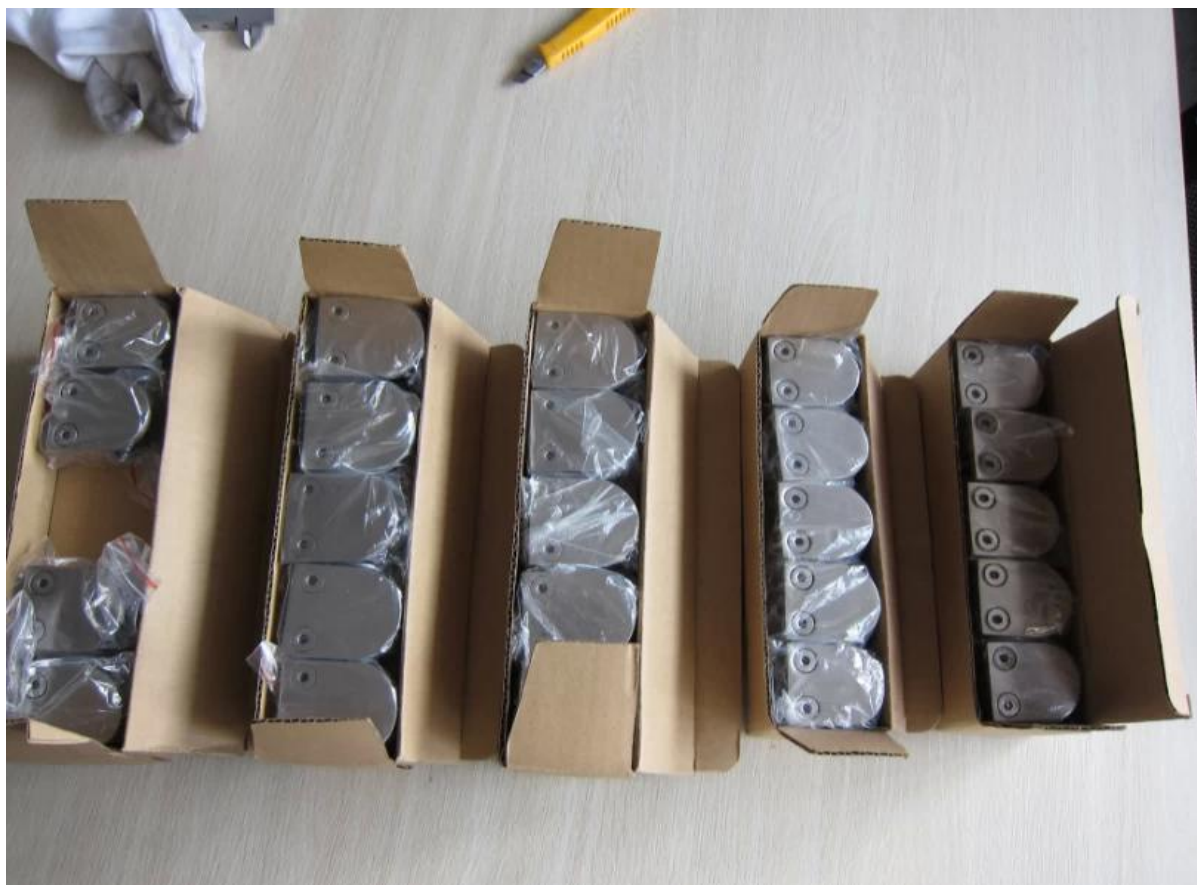
Projet de semi-cadre pour clôtures de piscine: