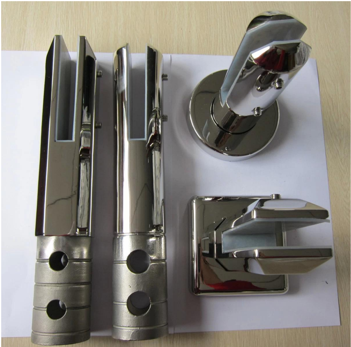
pic de projet