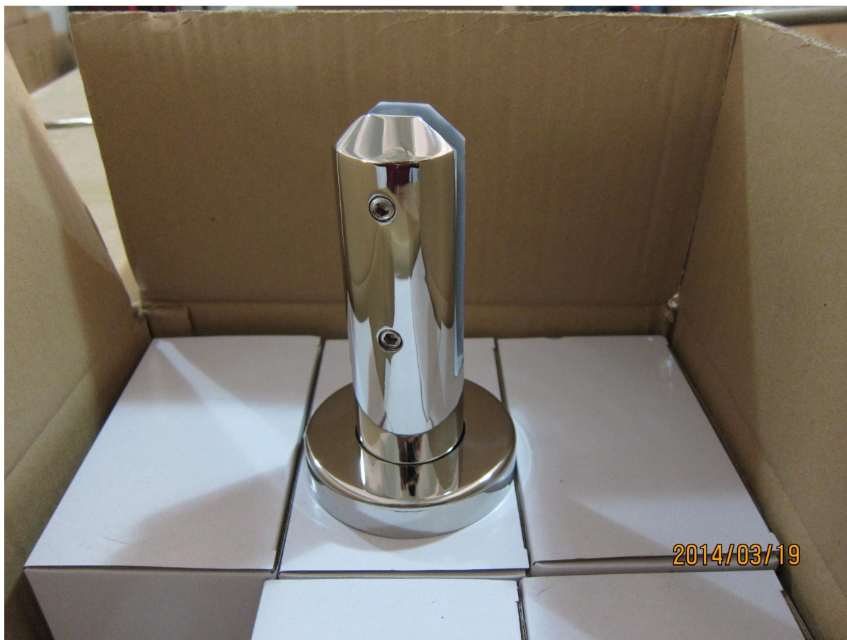
4 types SPIGOT: