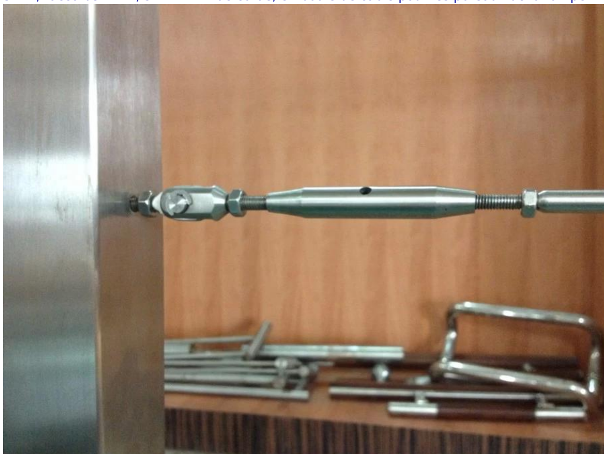
fil en acier inoxydable à l'intérieur du système corde de rampe pour la conception de l'escalier, inox304 / 316 câble balustrade avec tenseur de câble pour escalier et balcon