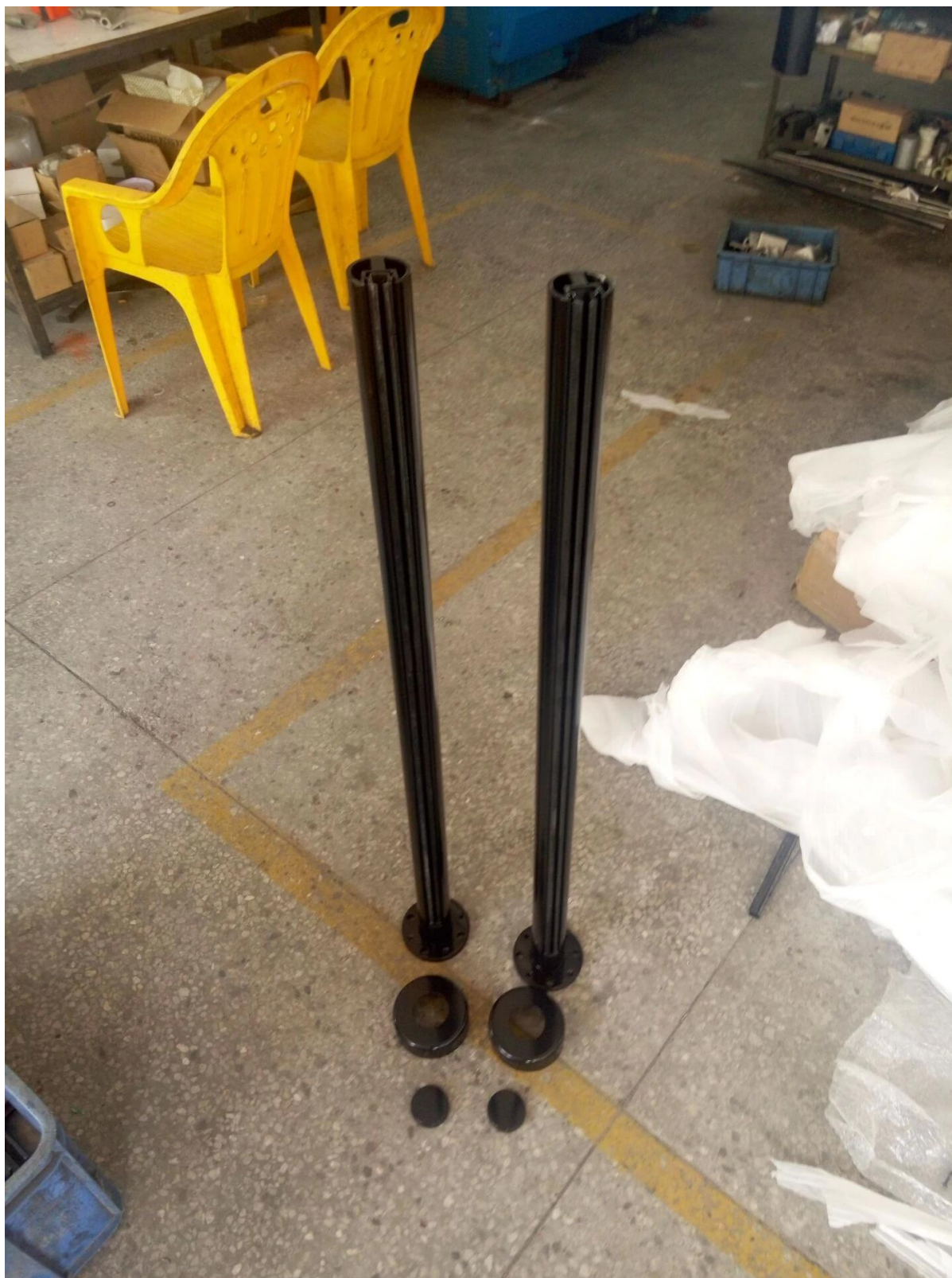
Μπαλκόνι, σχεδιασμός κατάστρωμα κιγκλίδωμα γυαλιού: