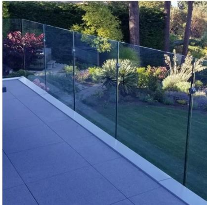
2 "Διάμετρος Γυαλί Σφιγκτήρες Standoff για τοποθέτηση σε ξύλινο υπόστρωμα: