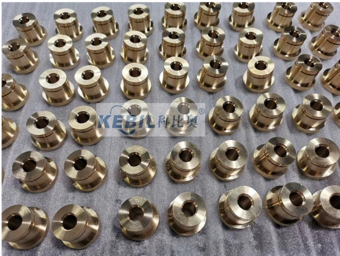
Σχέδιο σιδήρου από ορείχαλκο