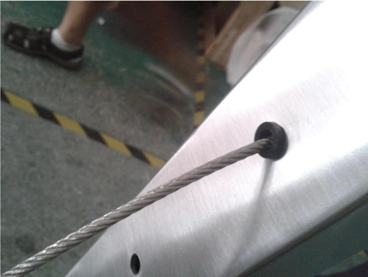
Κάλυμμα πόρτας από ανοξείδωτο χάλυβα (100x100mm)