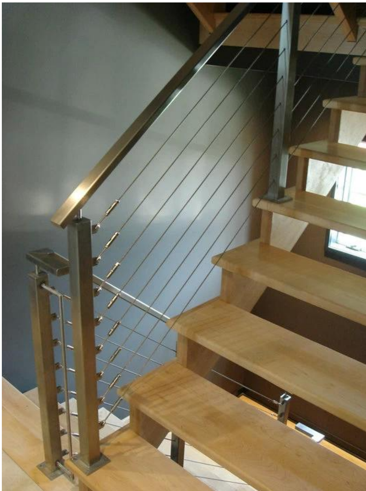
Καλύμματα καλωδίων για εξωτερικό μπαλκόνι και προστατευτικό κιγκλίδωμα