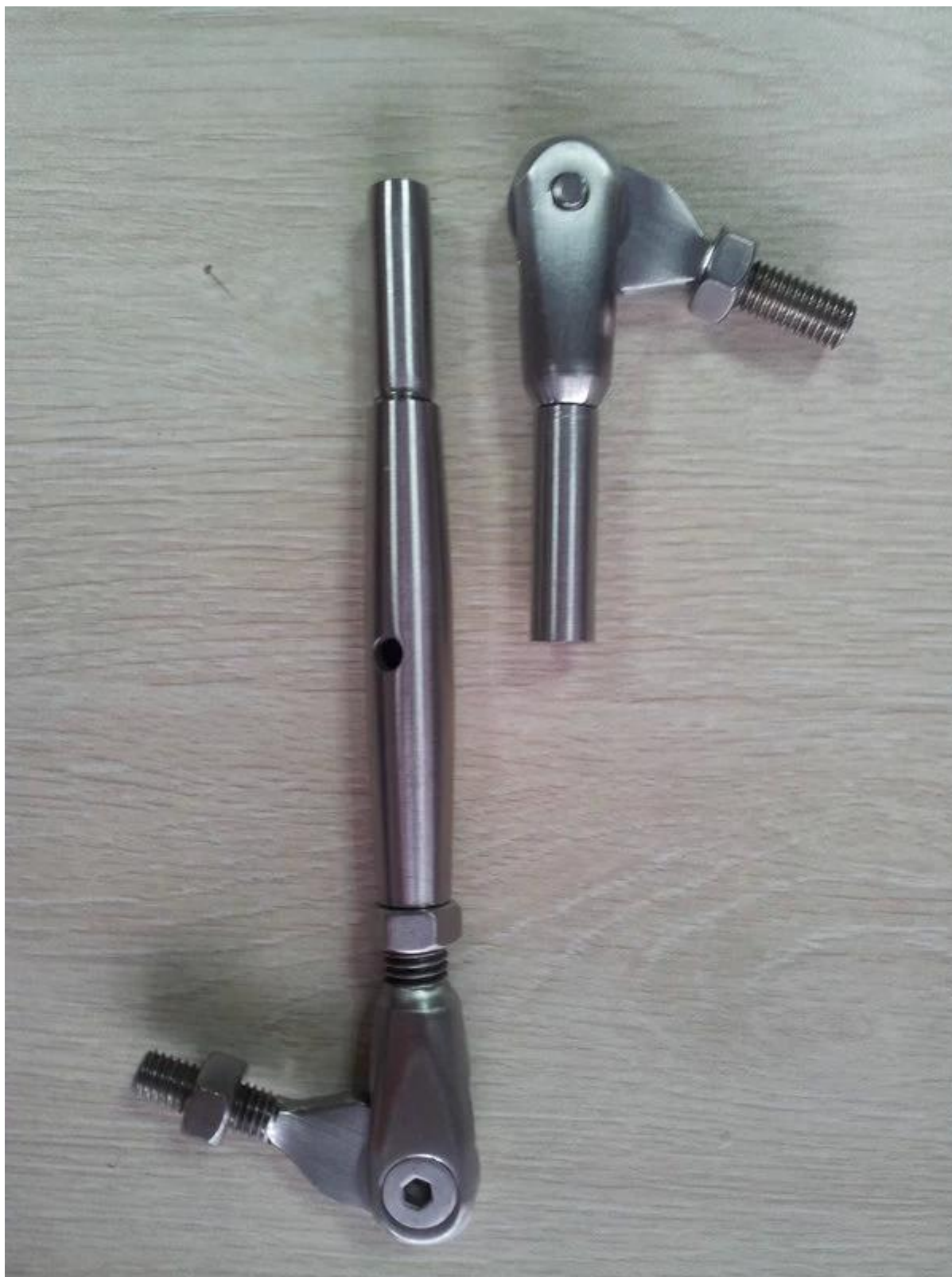
Έργο T804 στο Μίτσιγκαν, ΗΠΑ