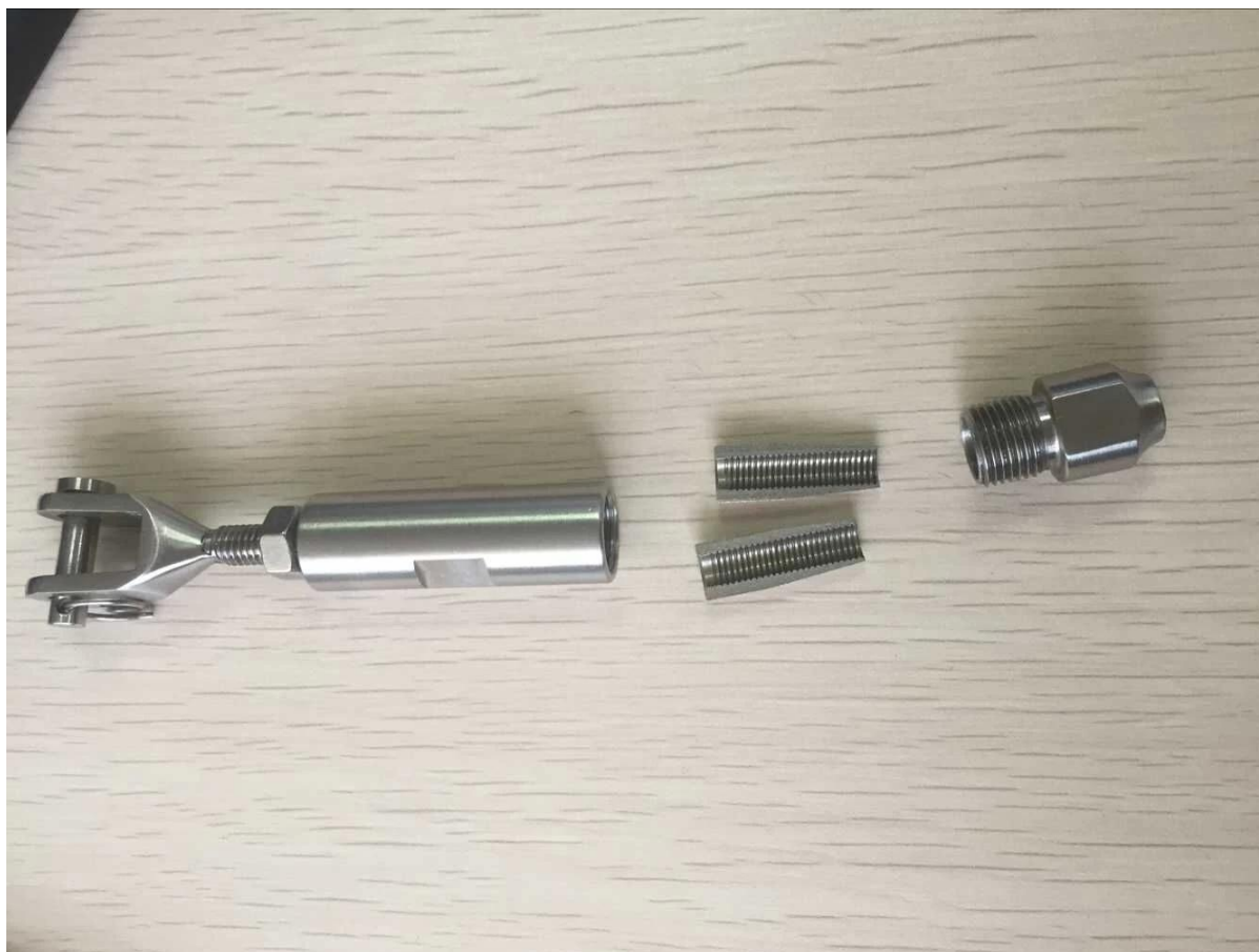
Καλώδιο εγκατάστασης εντατήρα