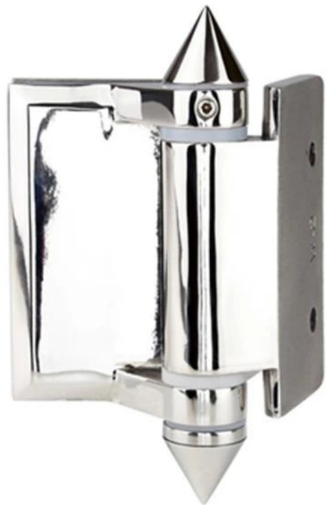
Μεντεσέδες από γυαλί σε τετράγωνο στύλο/τοίχο, G-W,επίστρωση μαύρης σκόνης