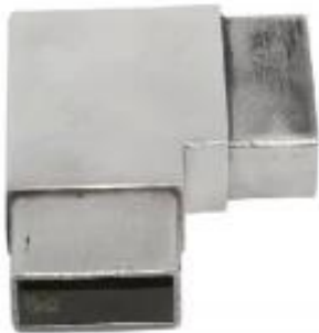
Handrail tube corner connector