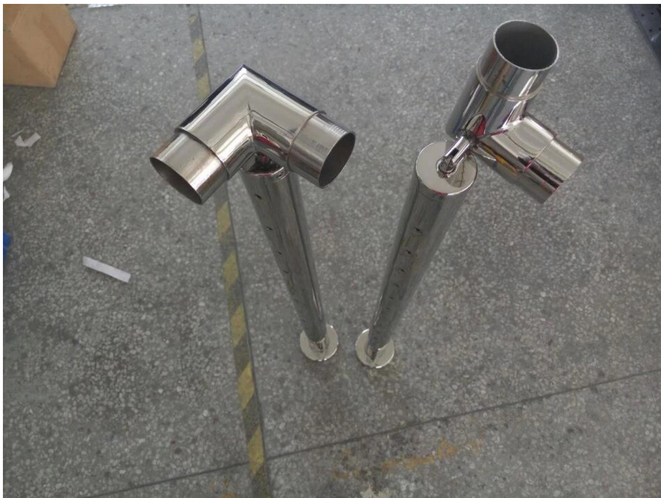
Τετράγωνο σχεδιασμό Top Mount Post: