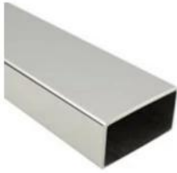
50*25(mm) handrail tube