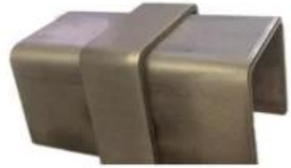
Handrail tube middle connector