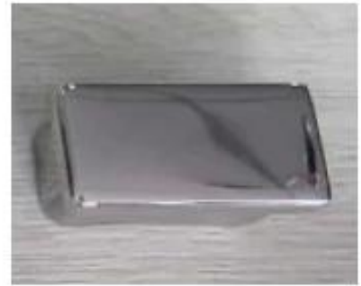
Handrail tube end cap