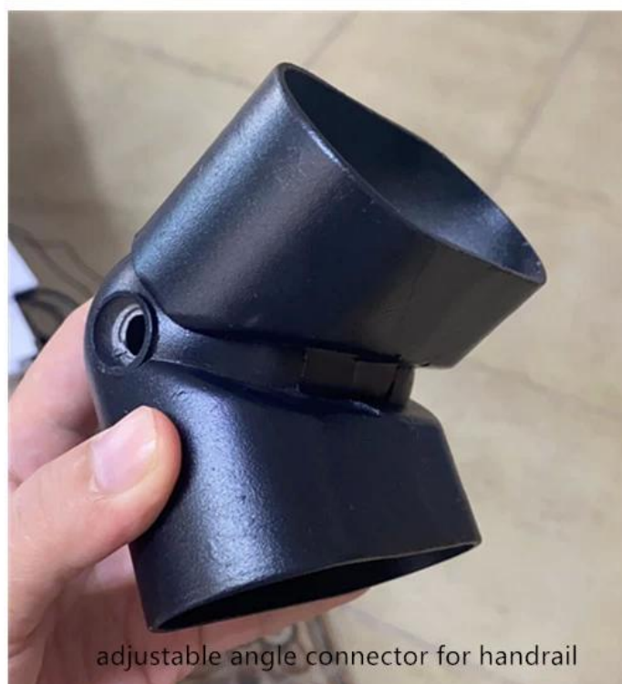
adjustable angle connector for handrail

# Φωτογραφίες παραγωγής μεταλλικών κιγκλιδωμάτων-