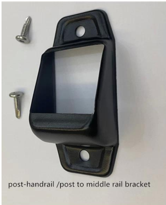
post-handrail /post to middle rail bracket