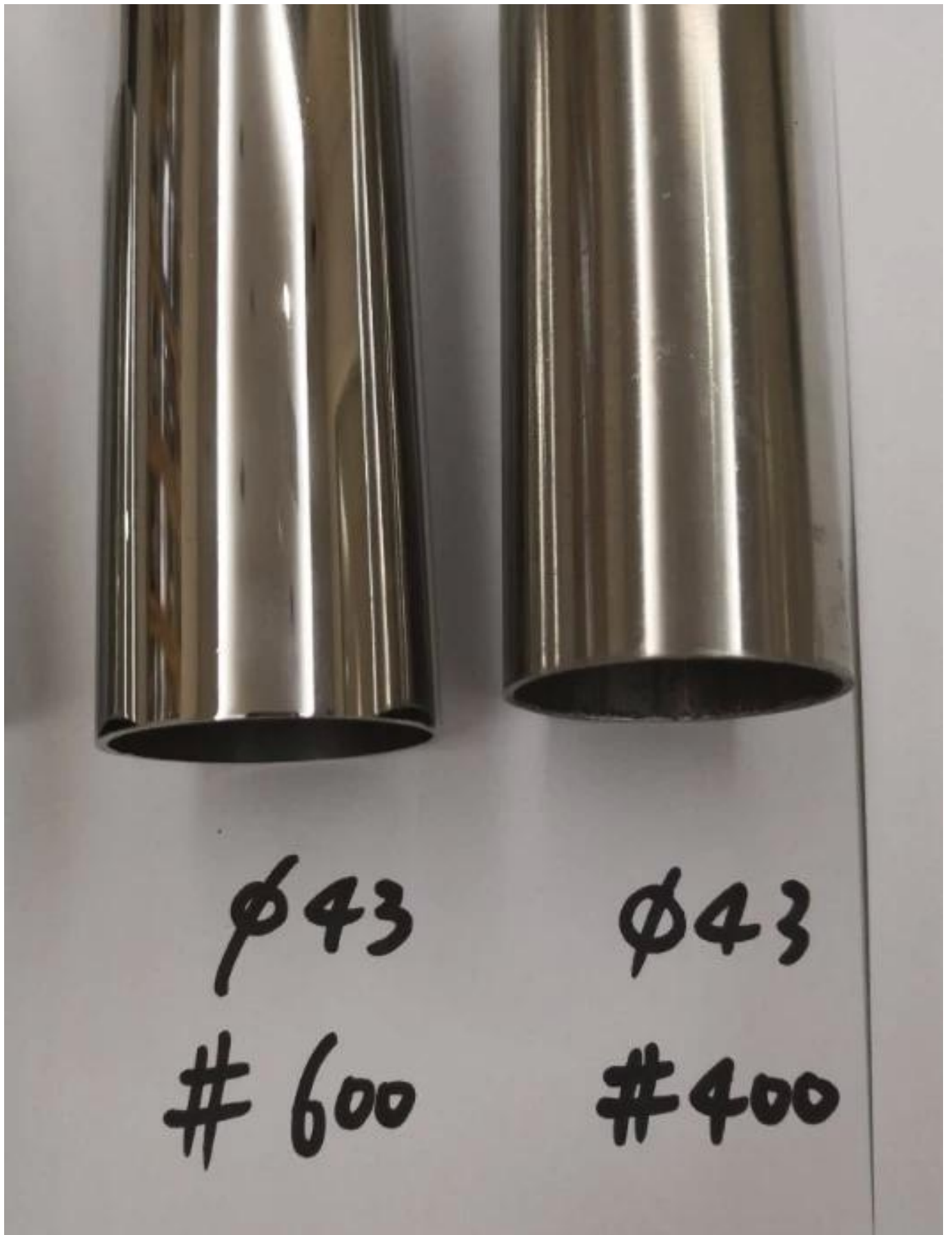
Φωτογραφίες παραγωγής από ανοξείδωτο χάλυβα χειρολαβής