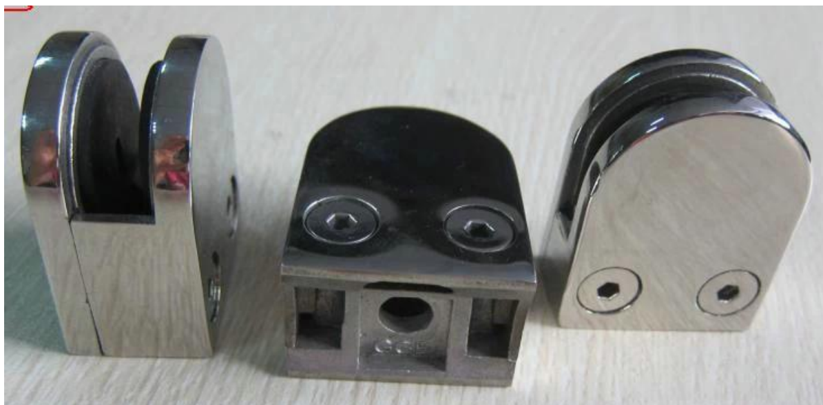
Διαφορά επεξεργασίας επιφανειών