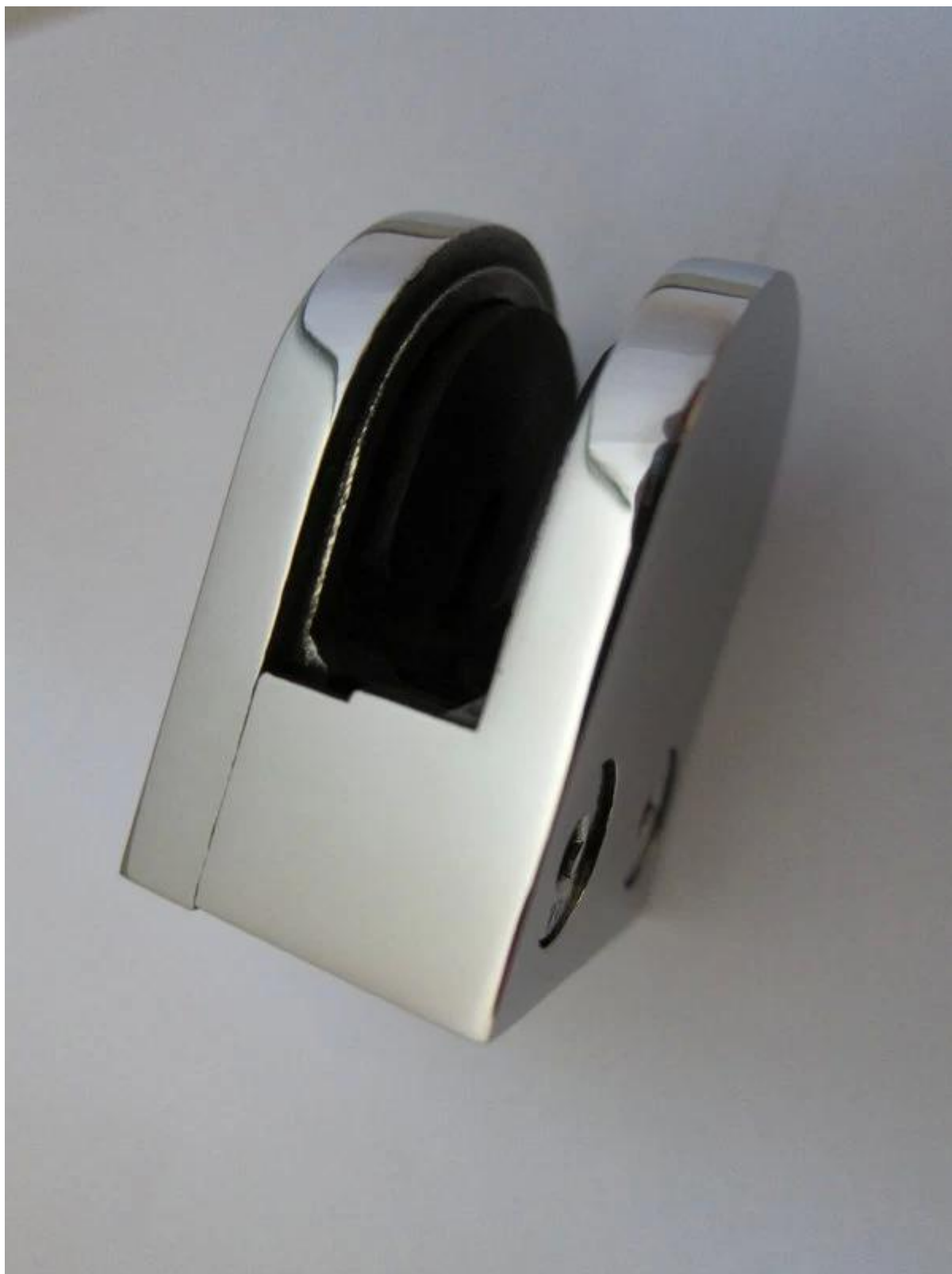
γυαλί κλιπ για το 10-12 mm πάχος γυαλί