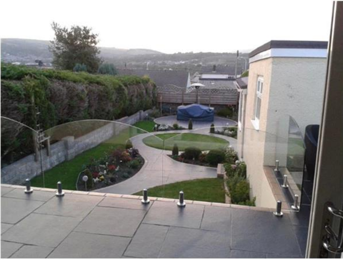
glass balustrade system