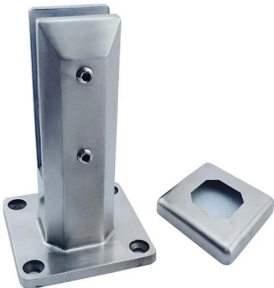
Φωτογραφίες του έργου