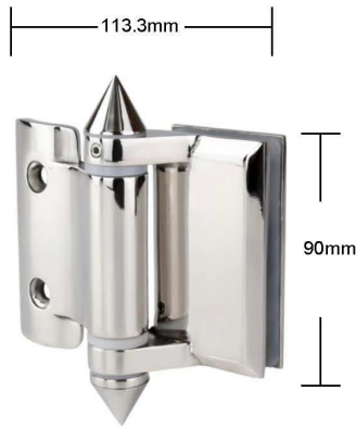
Part # G-R