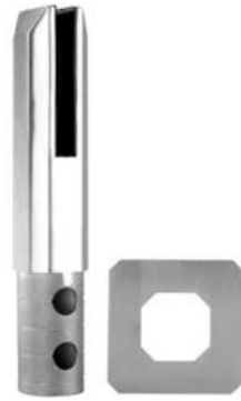
MODEL # SCM