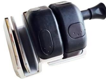
MODEL # GL-90