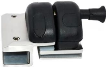
MODEL # GL-180

Γυάλινο μάνδαλο από ανοξείδωτο ατσάλι, κάντε κλικ στην παρακάτω φωτογραφία για περισσότερες λεπτομέρειες-