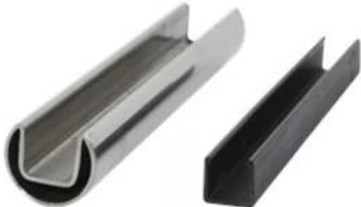
mini top rail