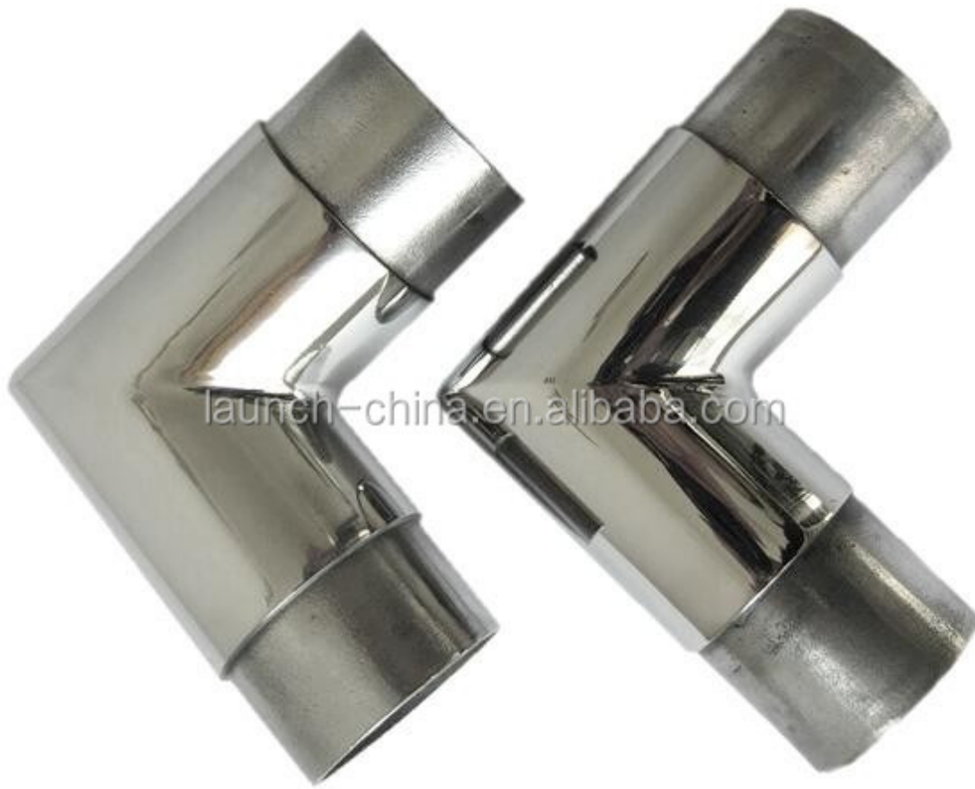
σύνδεσμος σωλήνα από ανοξείδωτο χάλυβα 8. Μοντέλο No.E305