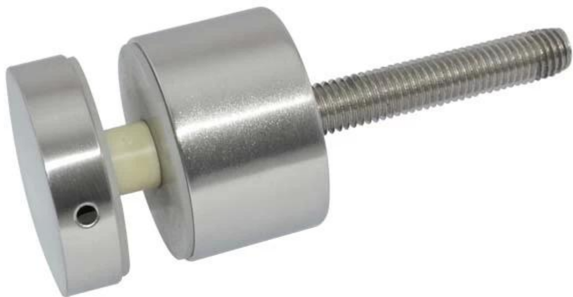
Foto di StandOff mensola staffa di vetro montaggio legno