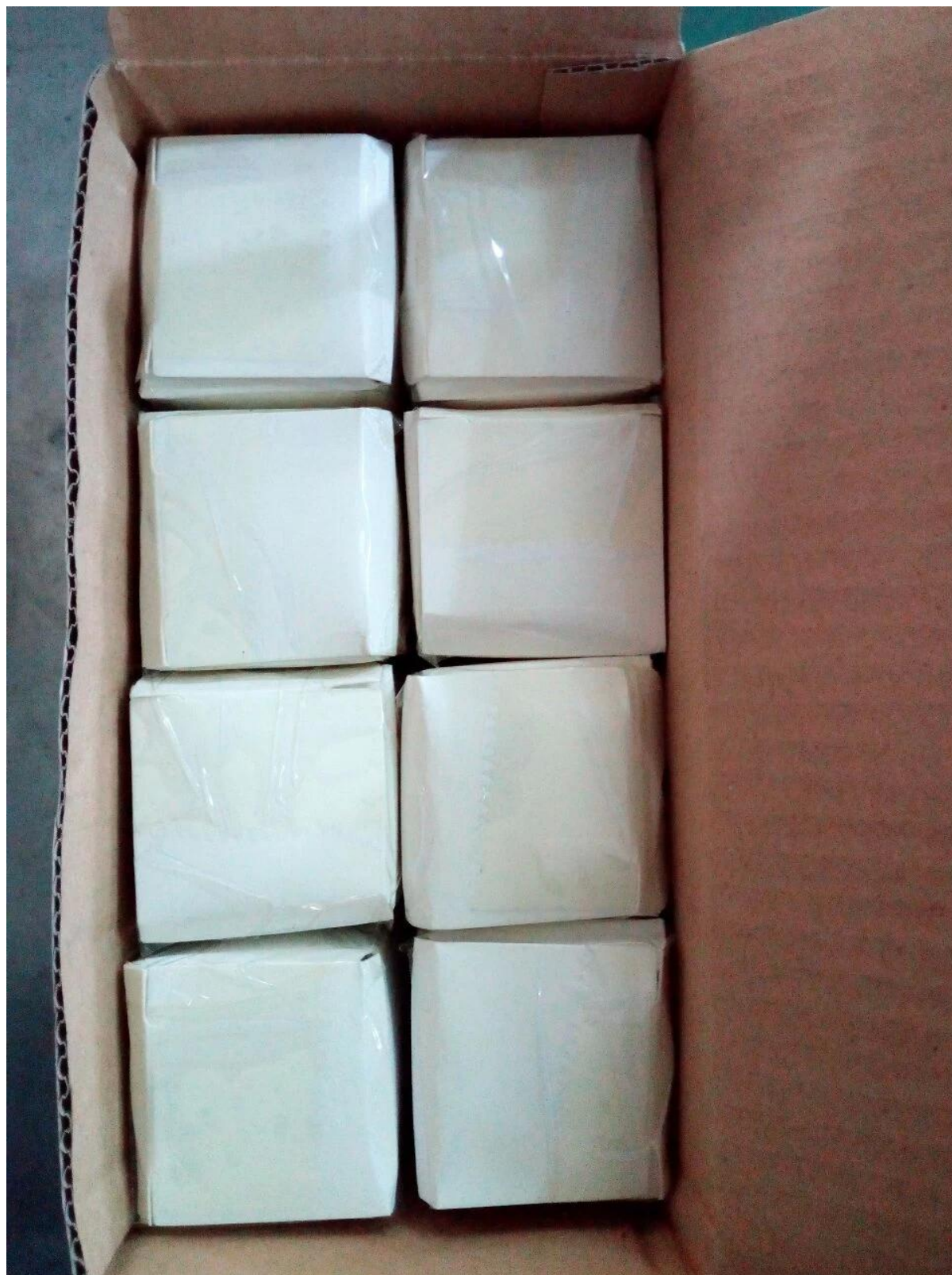
Foto di progetto per stallo alla ringhiera di vetro.