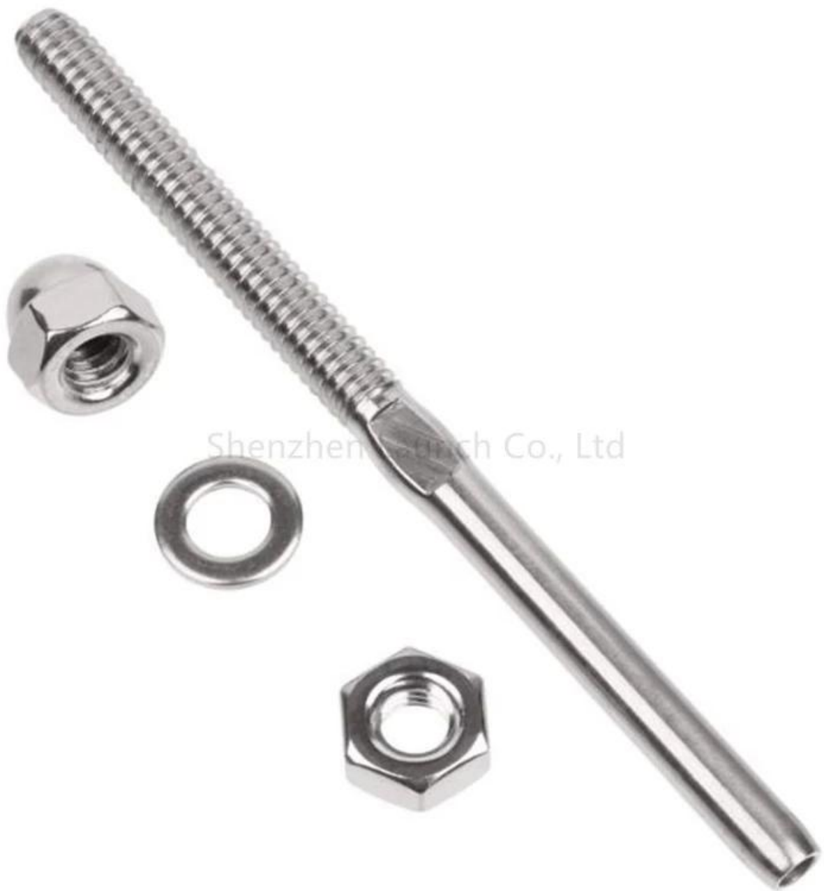
Foto di installazione -