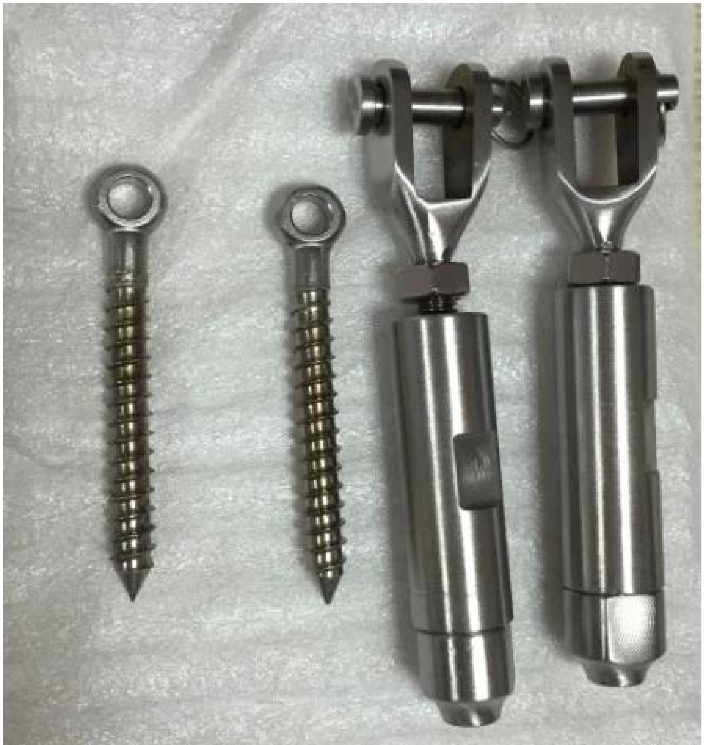
FOTO DI INSTALLAZIONE PER TENDITORE TENSIONATORE TIRE