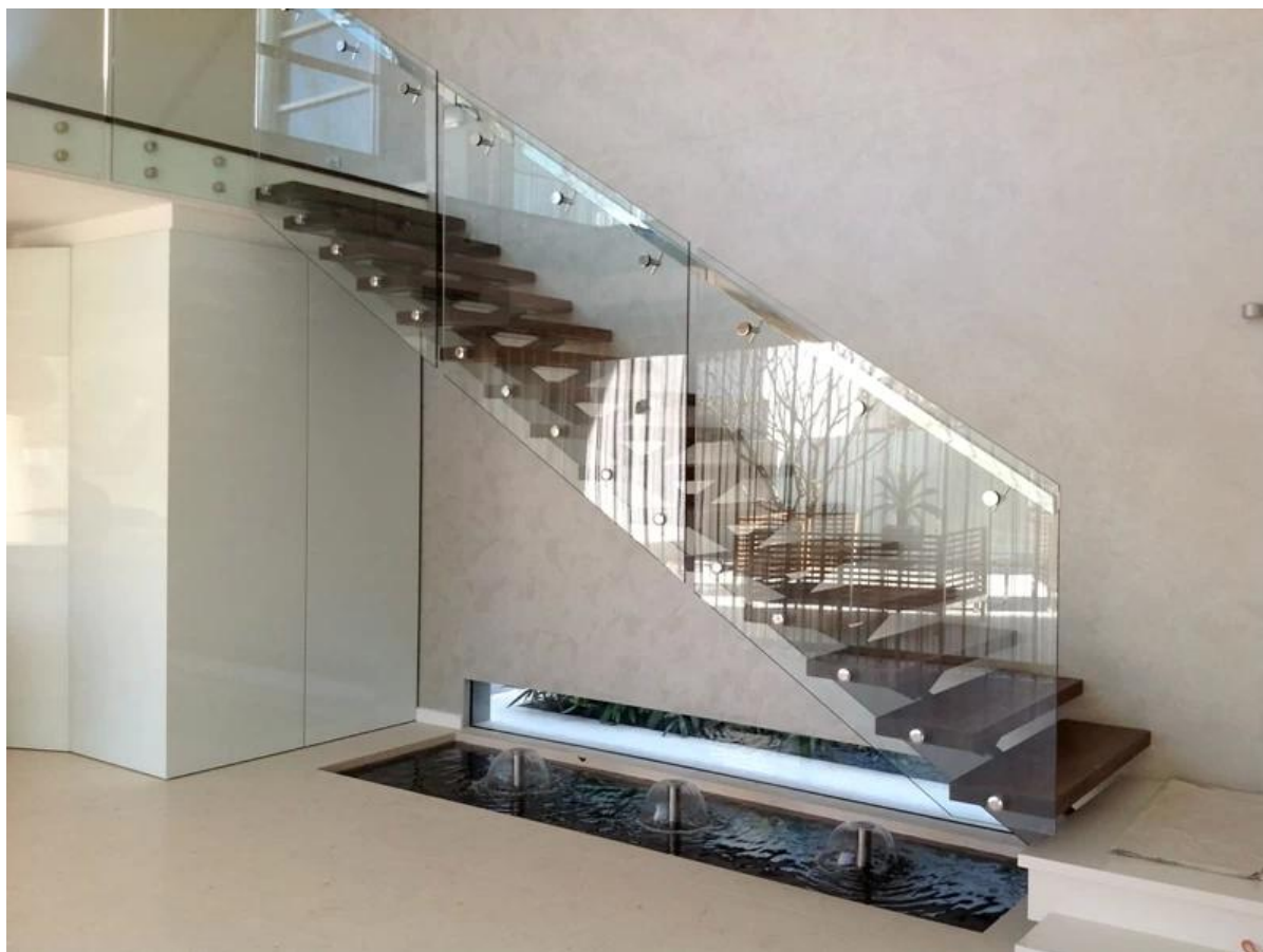
Disposizione di vetro in acciaio inossidabile per la balaustra in vetro senza cornice