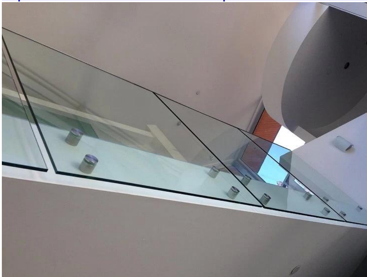
chiusura in acciaio inossidabile, staffa per pannelli in vetro, disegno a ringhiera