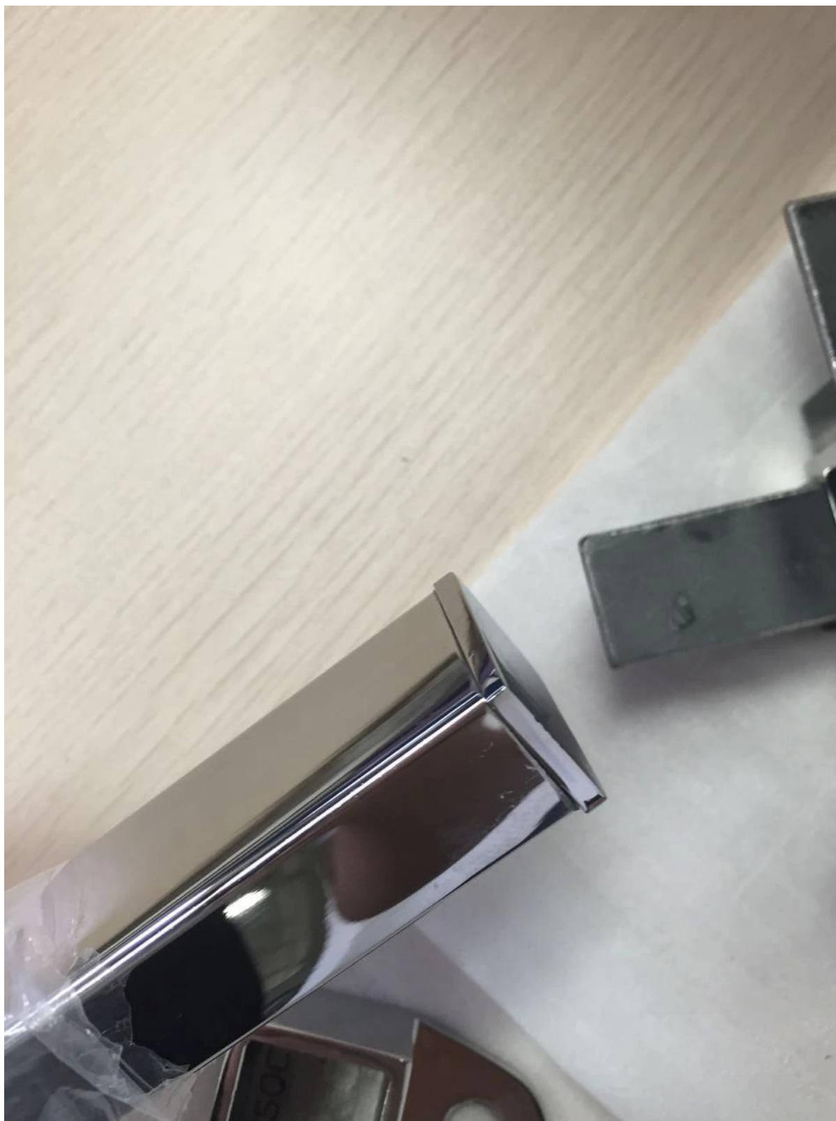
giro di slot corrimano e raccordi