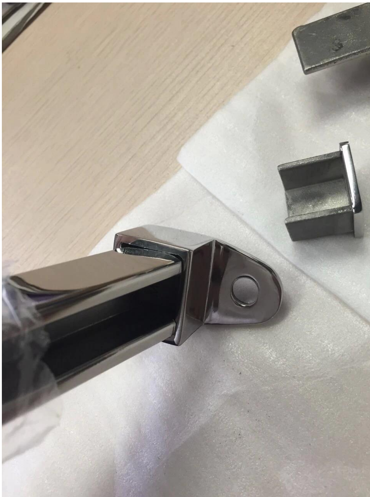
tappo di chiusura