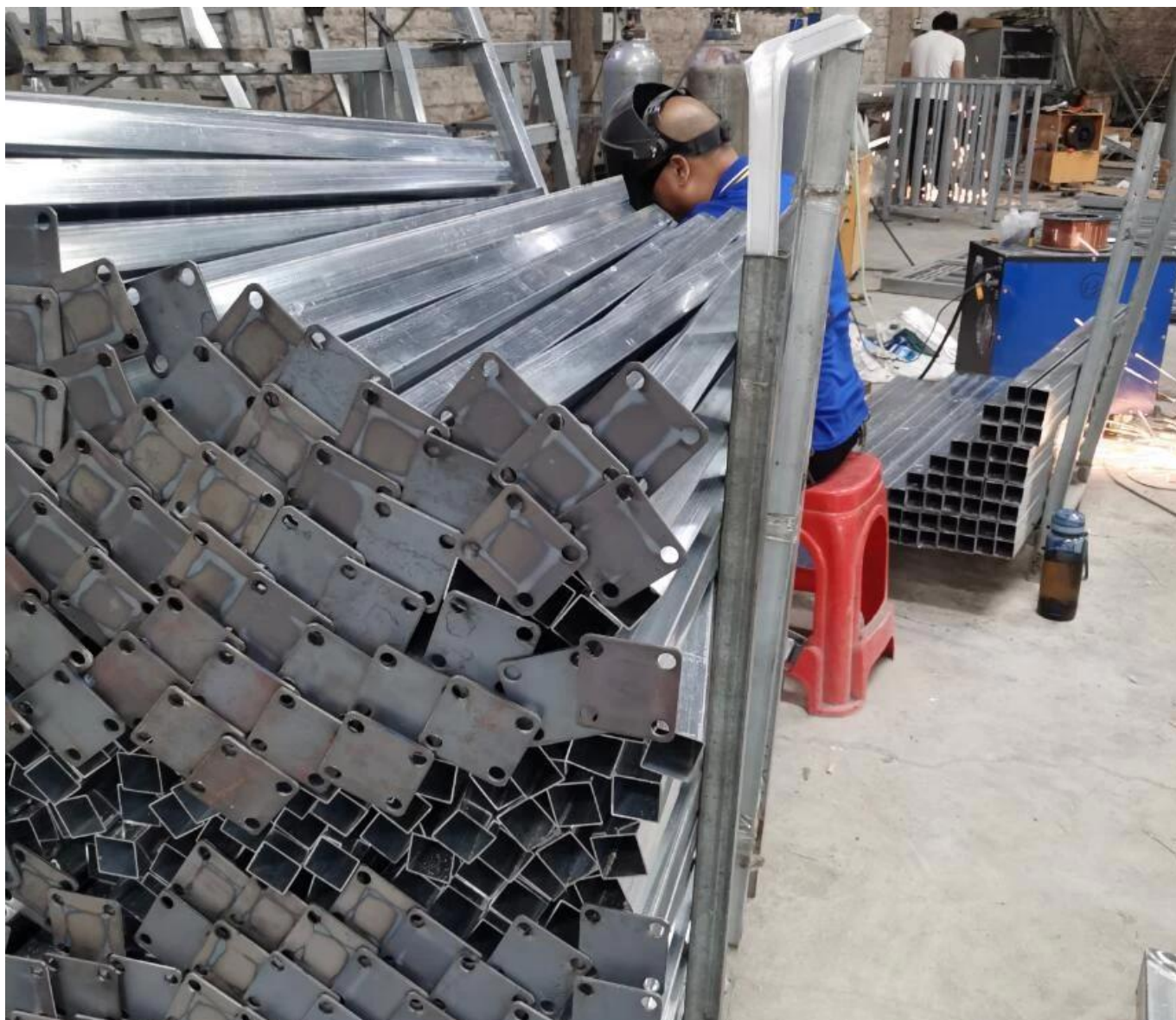
Verniciatura a polvere di ringhiere in alluminio