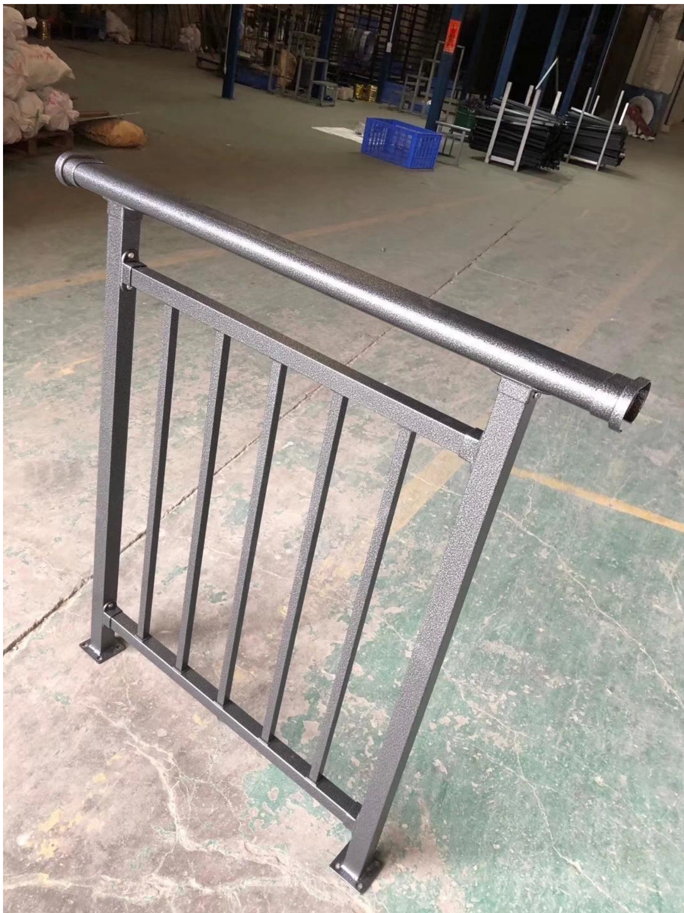
# Foto di produzione - processo di saldatura di ringhiere in alluminio -