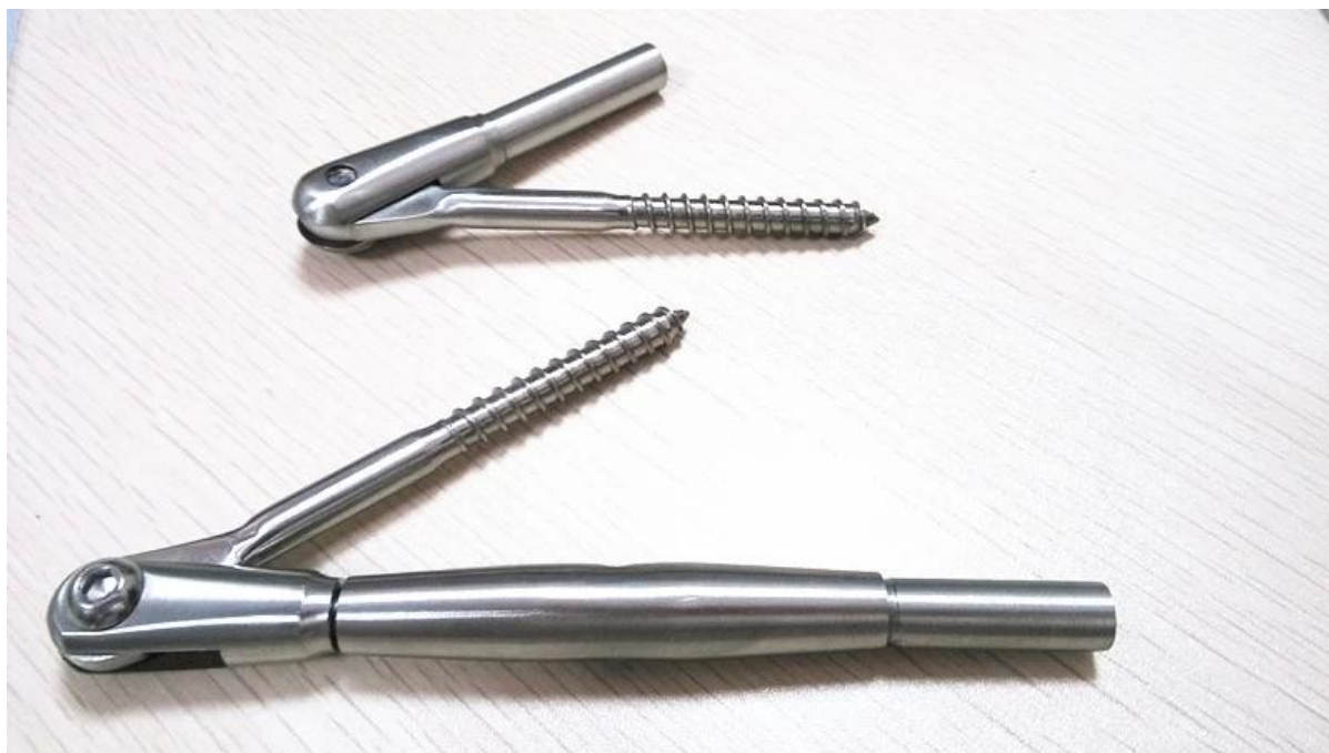
Tendicatena T804 con fissaggio a bullone su montante in acciaio.