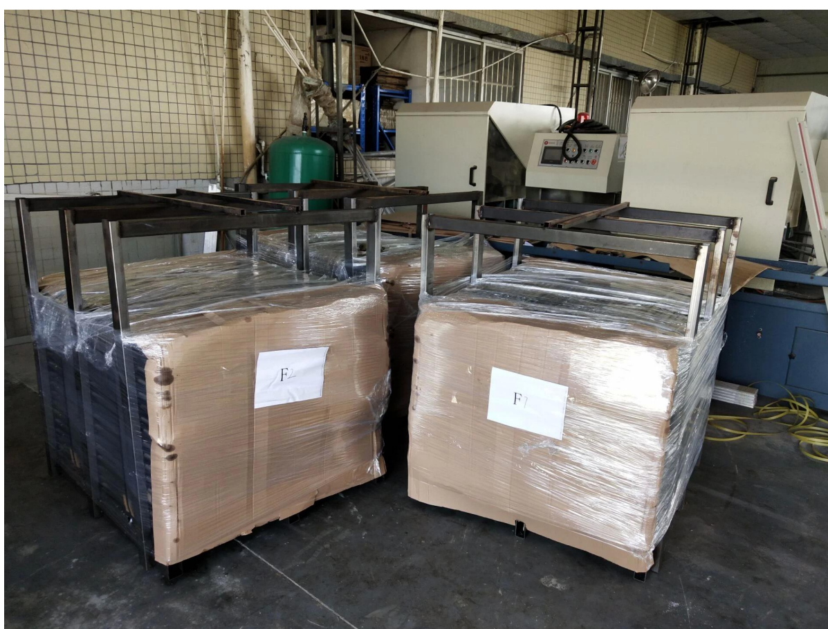
Immagini del progetto