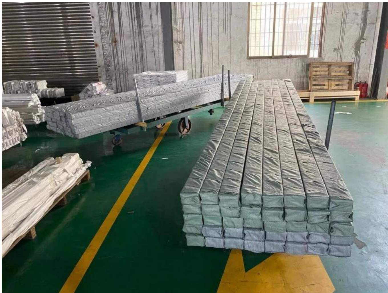
Project Photos Punnello Sistema di ringhiera di vetro di alluminio