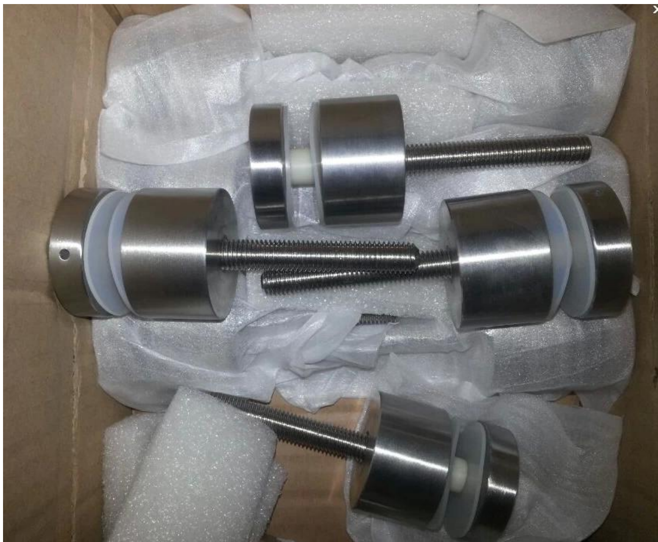
Progetto ringhiera in vetro STAniless in acciaio: