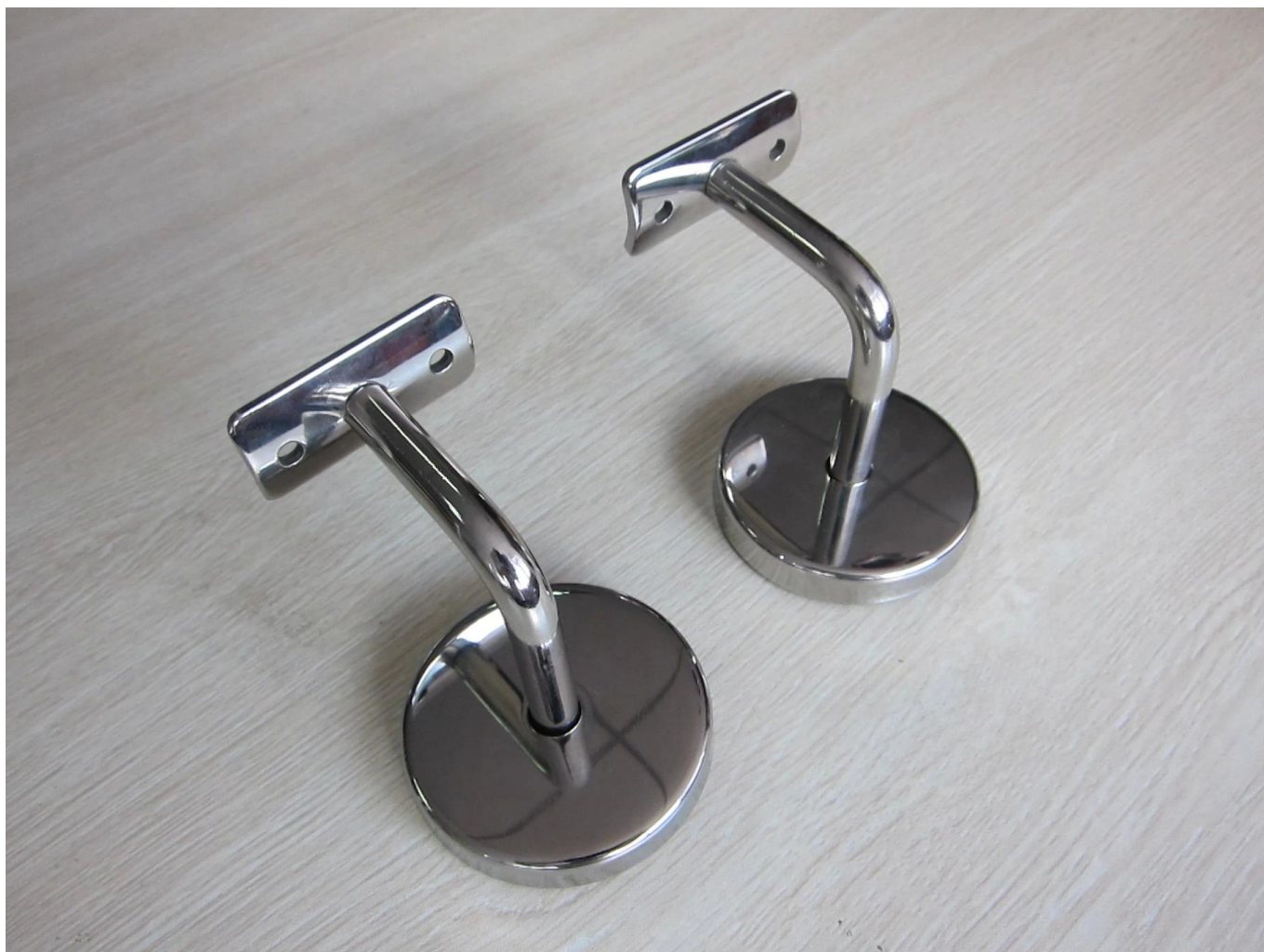
2). Staffa per corrimano a parete in acciaio inossidabile con ringhiera in vetro modello n. P706