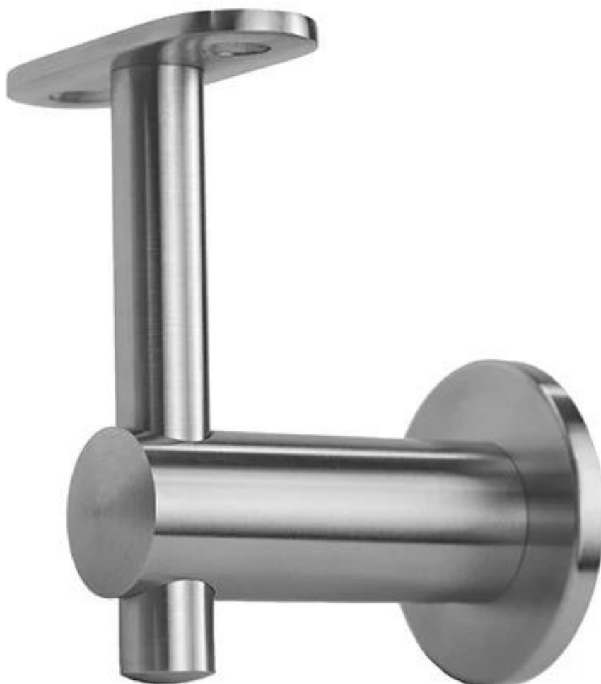
3). Modello n. P707 ringhiera in vetro staffa corrimano a parete in acciaio inox