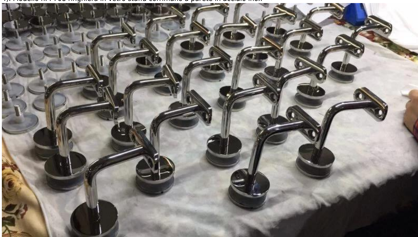
3. ringhiera in vetro staffa corrimano a parete in acciaio inox foto per riferimento : Progetto staffa corrimano regolabile :