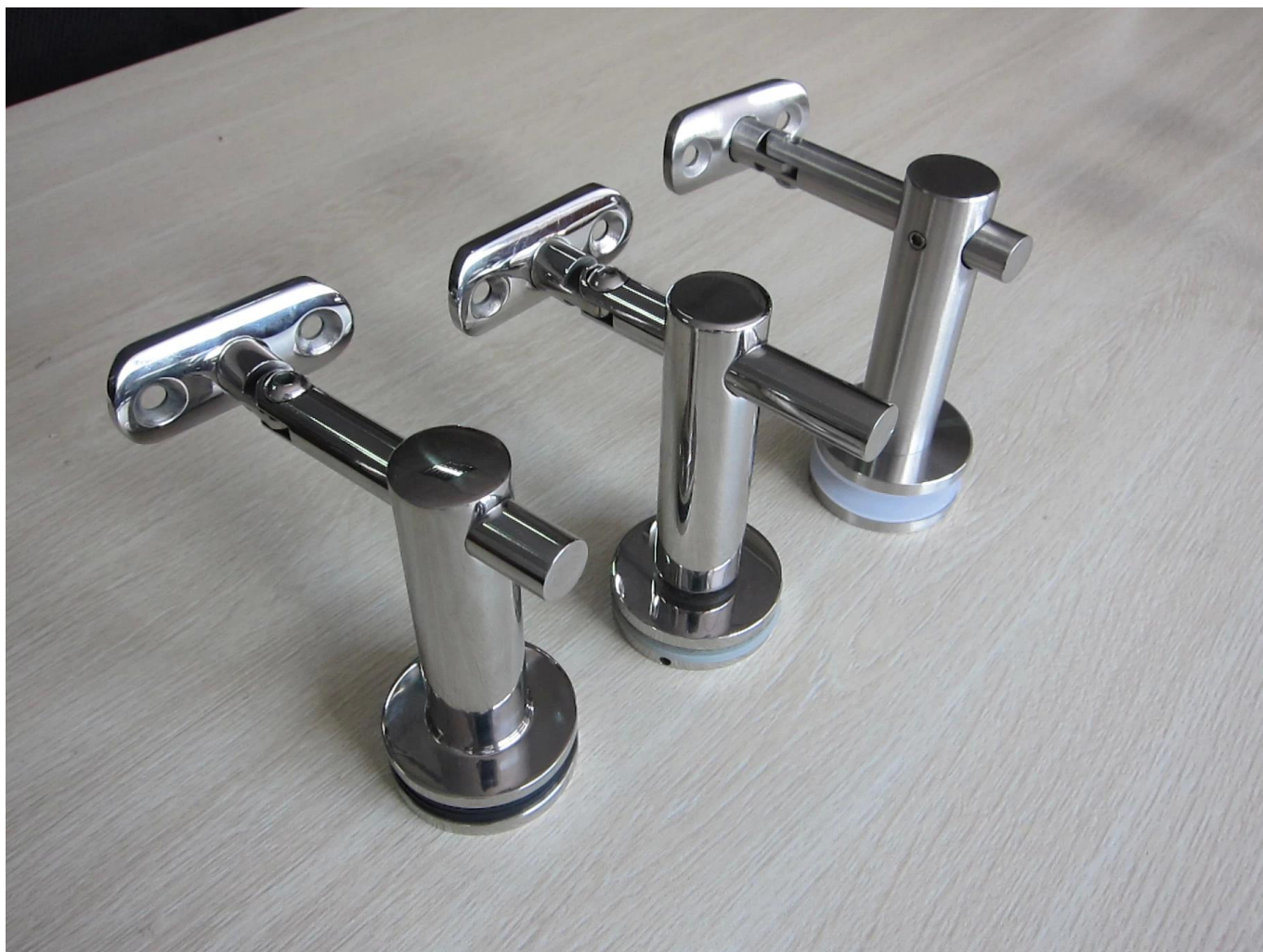
4). Modello n. P708 ringhiera in vetro staffa corrimano a parete in acciaio inox