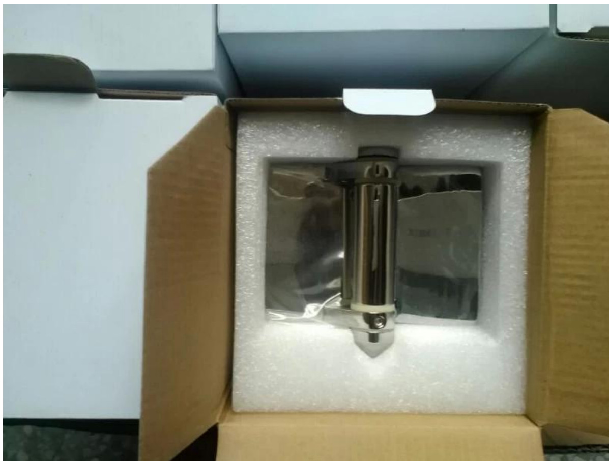
Vetro a cerniera del cancello di vetro per piscina frameless progetto recinzione