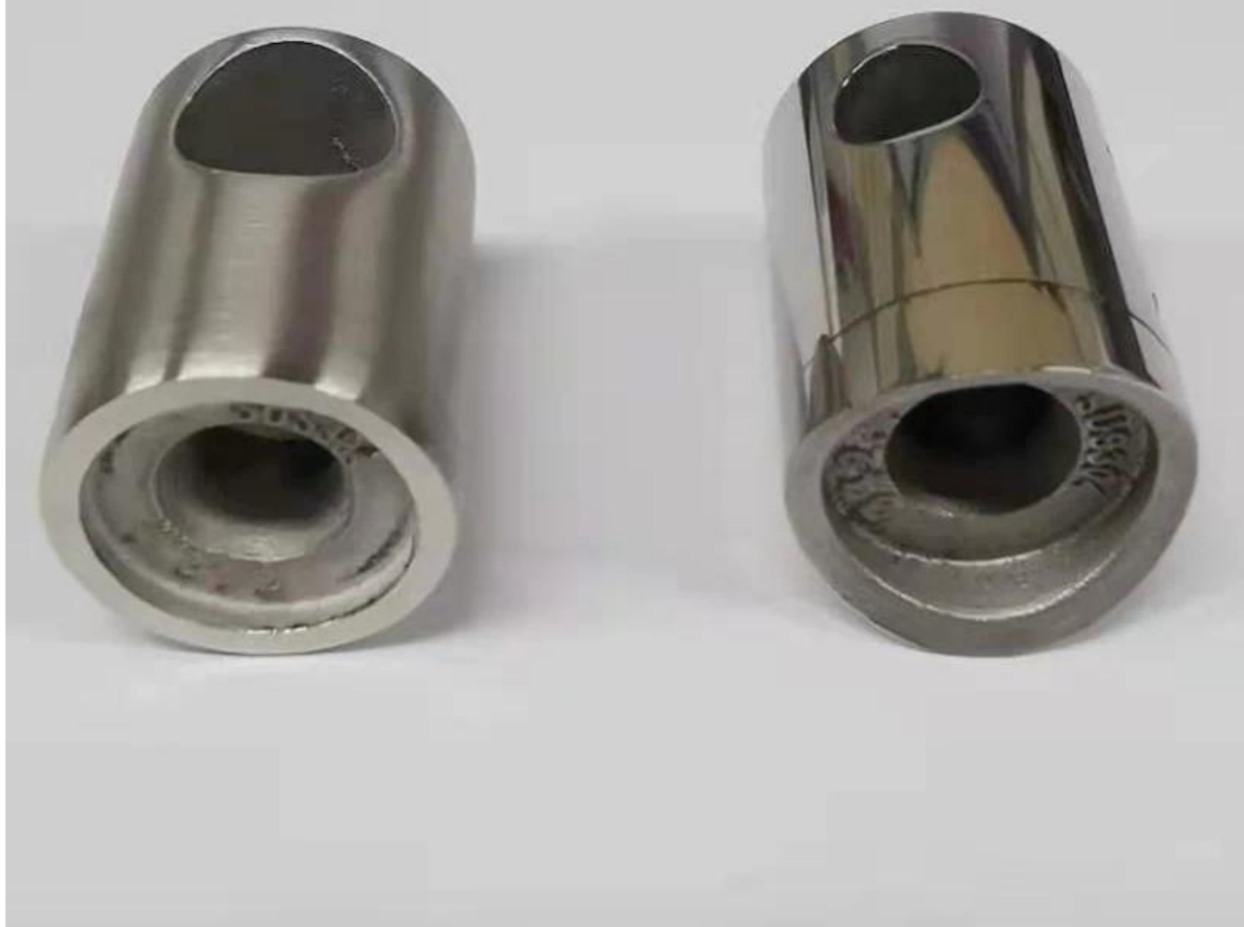
2. Diverso Dimensione Disegniper Connettore a barre a barre a barre trasversale in acciaio inox