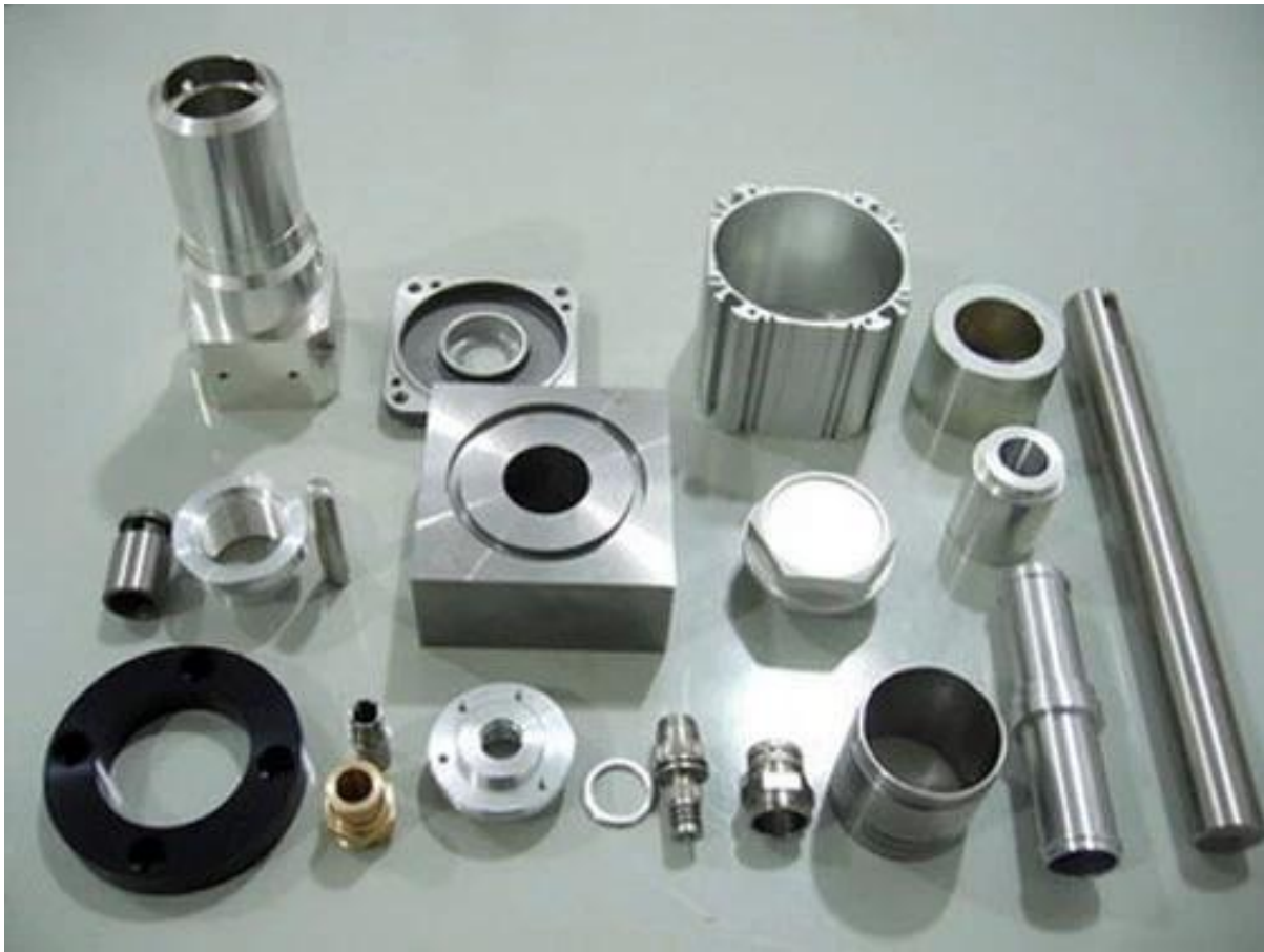
produzioni di massa parti CNC di alta qualità su misura