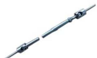
T809- 4mm/5mm cable