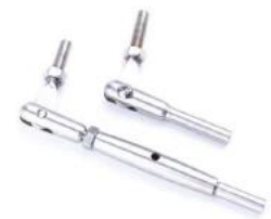
T804- 4mm/5mm/6mm cable