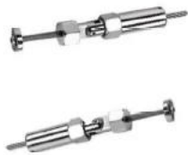
T802- 5mm/6mm cable