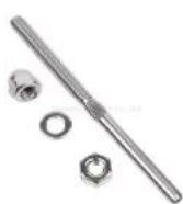
T805- 3mm cable