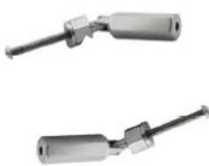
T801- 3mm/4mm cable