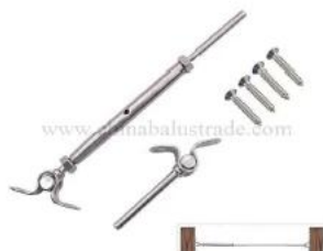
T806- 4mm cable