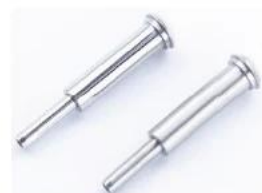
T807- 3mm/4mm cable