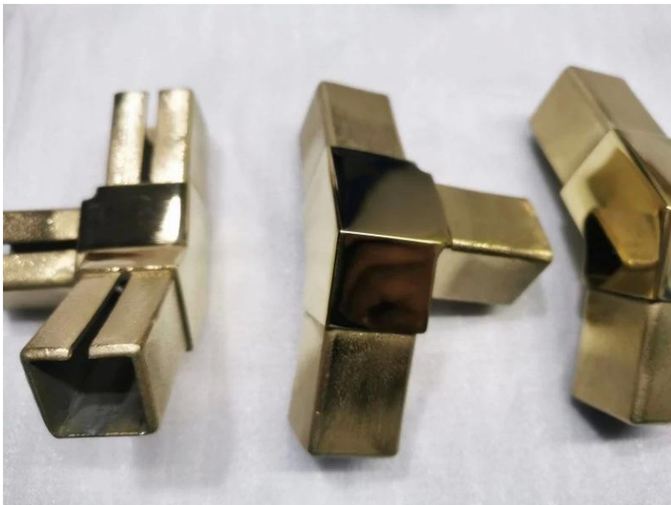
Connettore a tubo a 90 gradi a 90 gradi