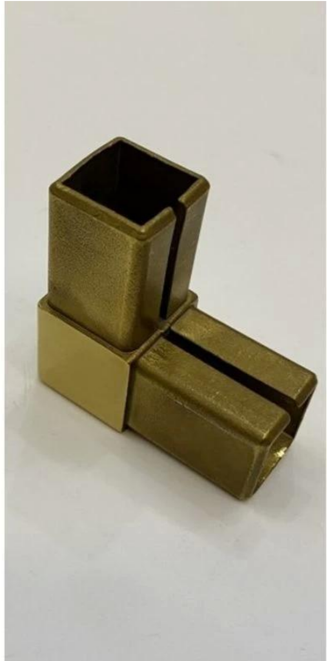
Connettore a tubo a 2 vie a 120 gradi