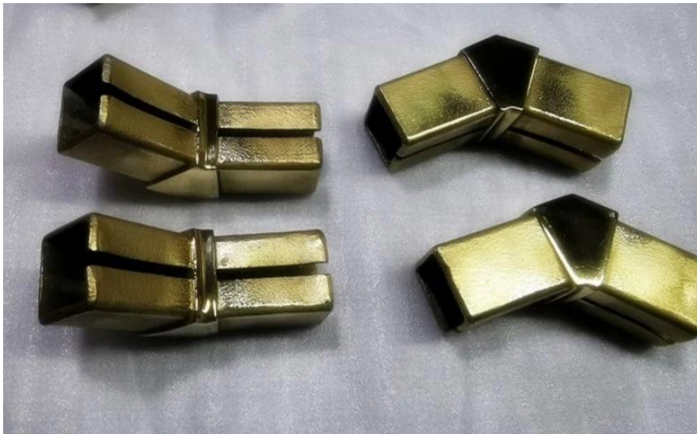
Connettore a tubo a 90 gradi a 90 gradi