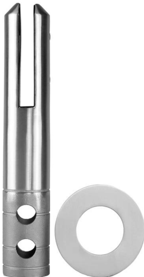
Spigot in vetro per montaggio su cruscotto