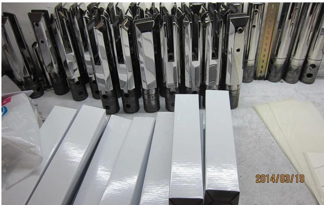
Accessori per recinzioni per piscine in vetro correlati- Cerniera in vetro E chiusura in vetro.

Foto progetti di recinzioni per piscine-