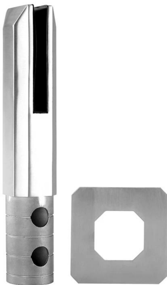
Perno tondo in vetro per carotaggio, modello # RCM-