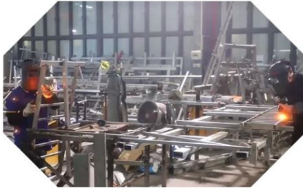
WELDING & POLISHING