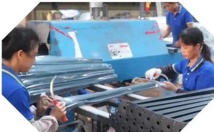
INSPECTION & PACKAGING