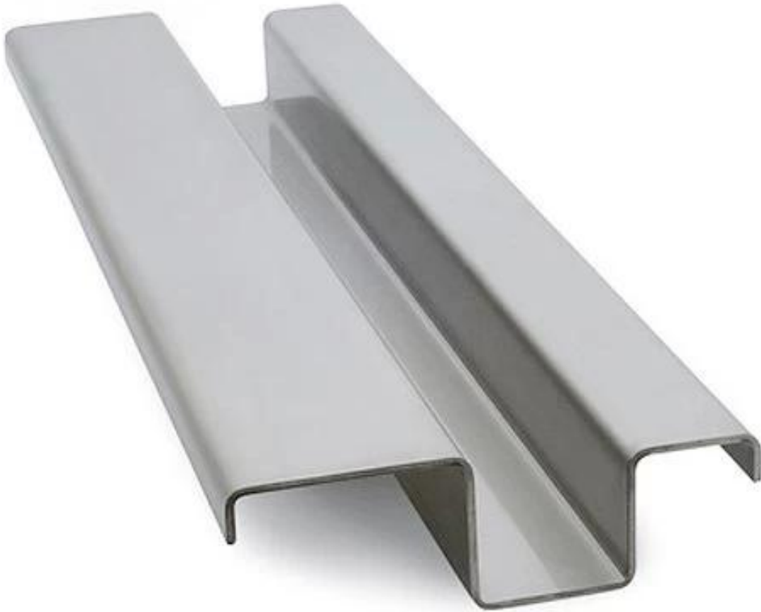
Colata di metallo