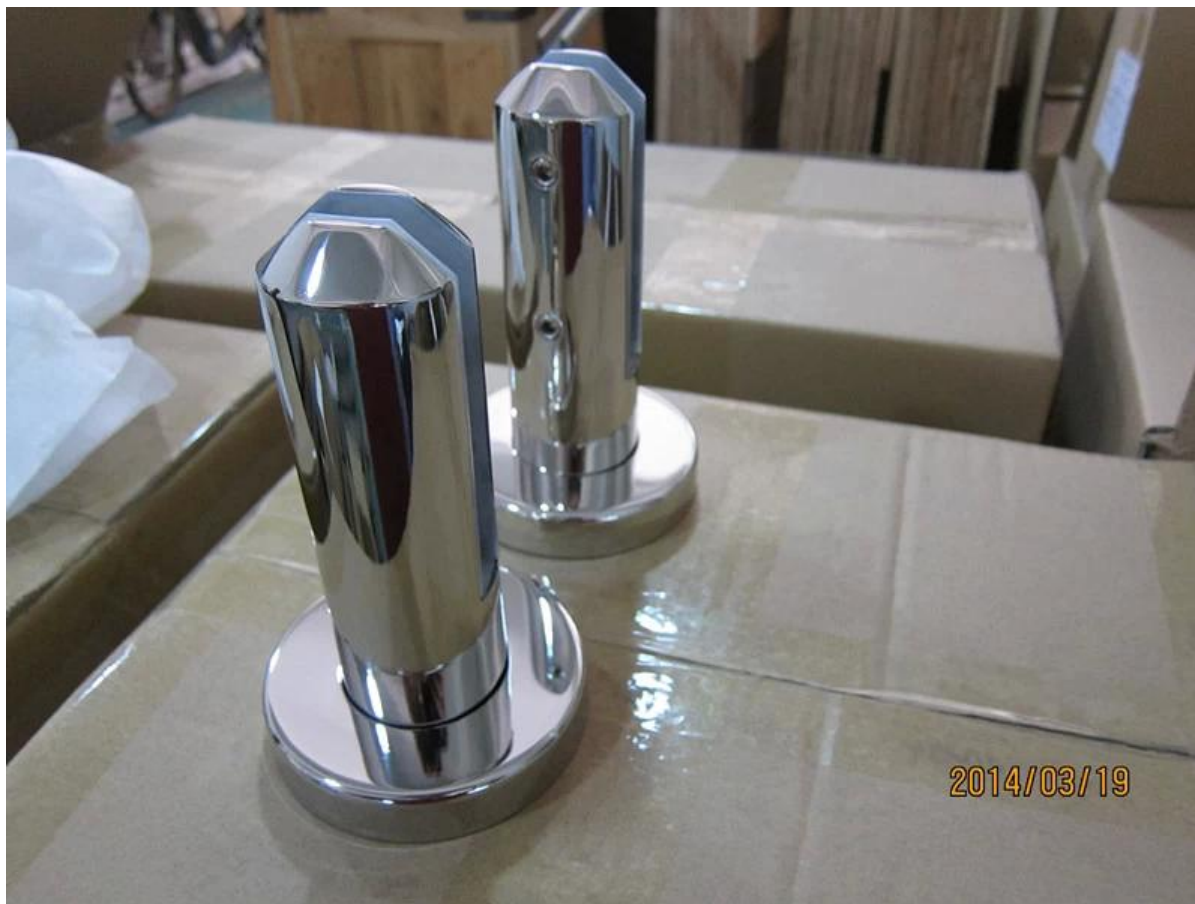
4) .Più modelli di morsetto per rubinetto in vetro