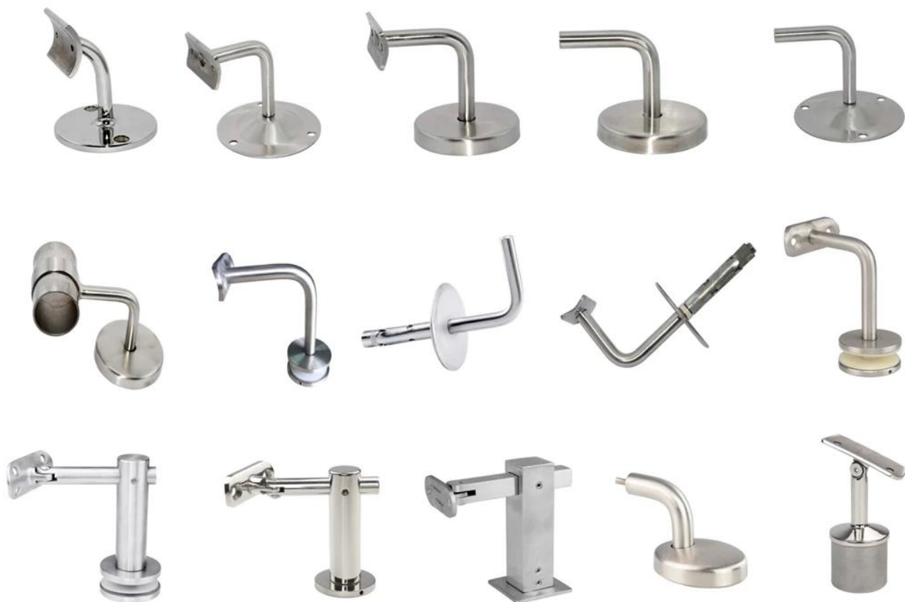
Foto del progetto della staffa del corrimano

Altri disegni per parentesi del corrimano: