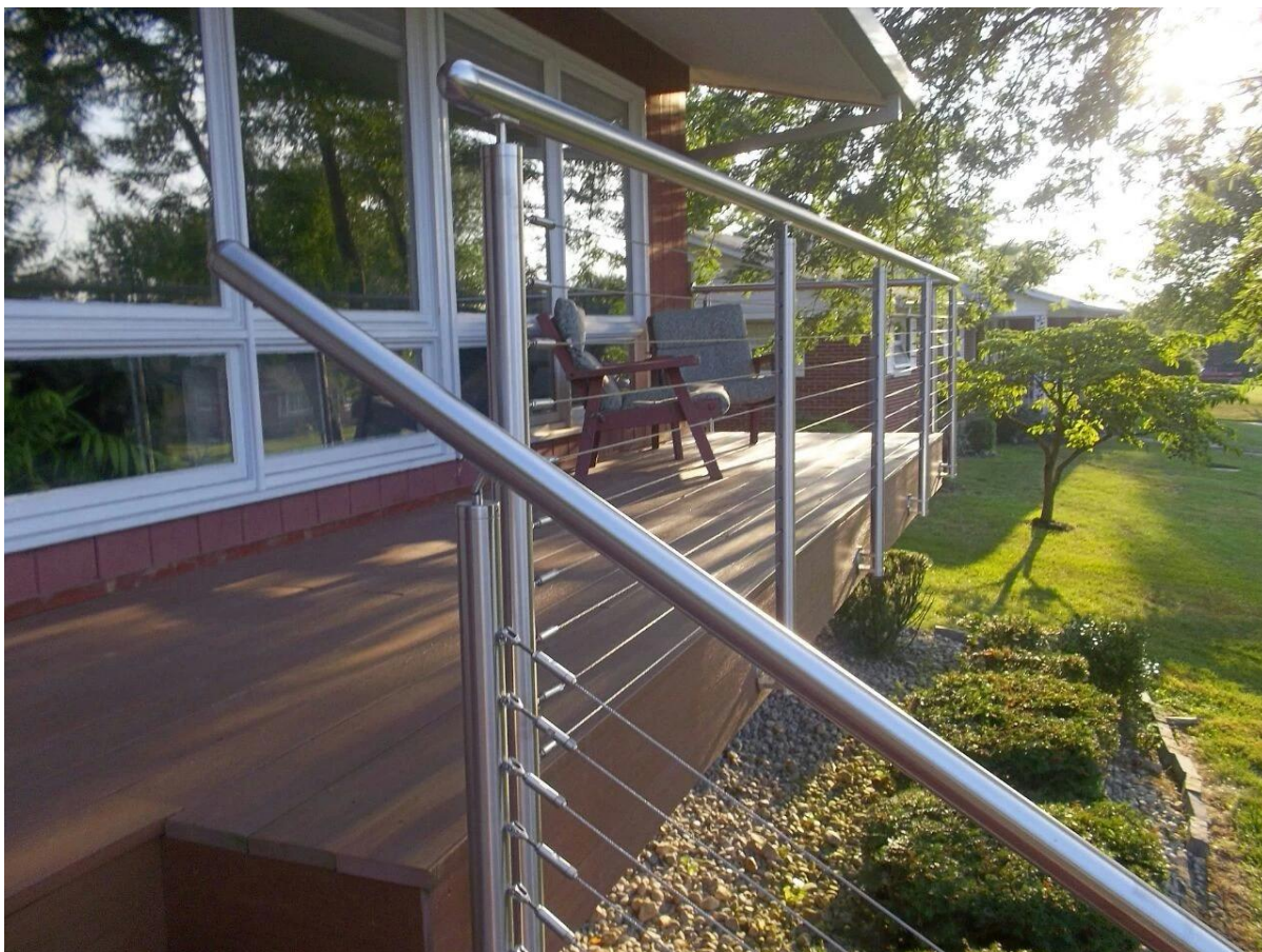
Foto Installtion di cavo in acciaio inossidabile balaustra