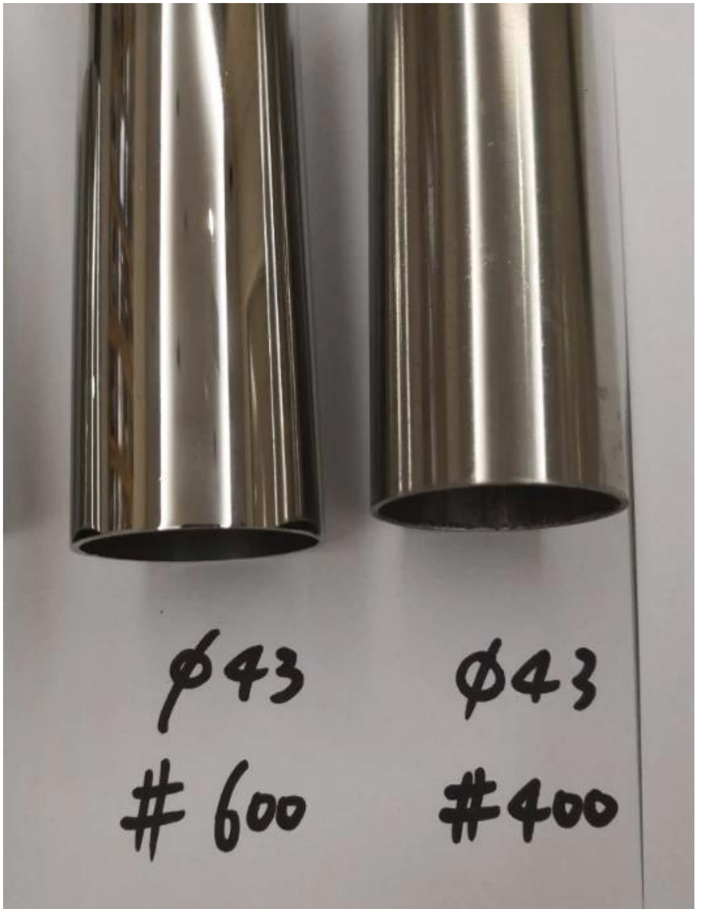
Foto di produzione per tubo corrimano in acciaio inossidabile