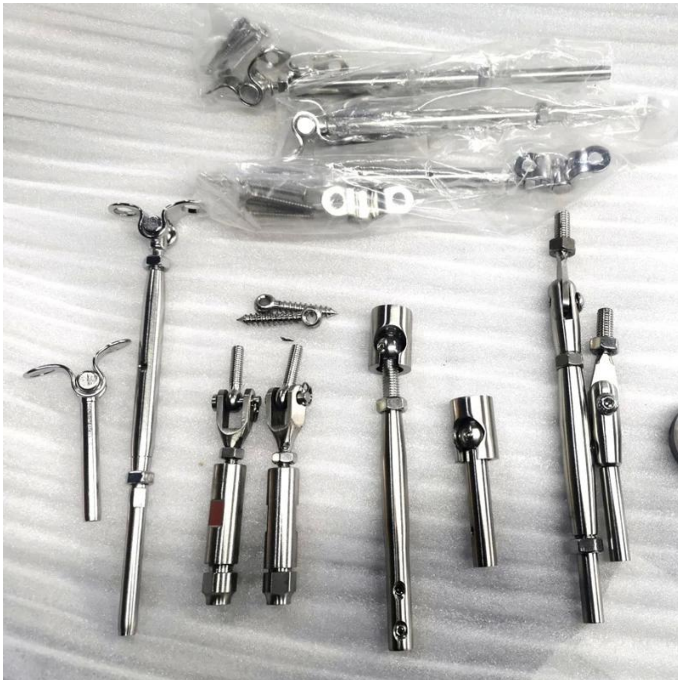
Tendegianti del cavo nero opaco-