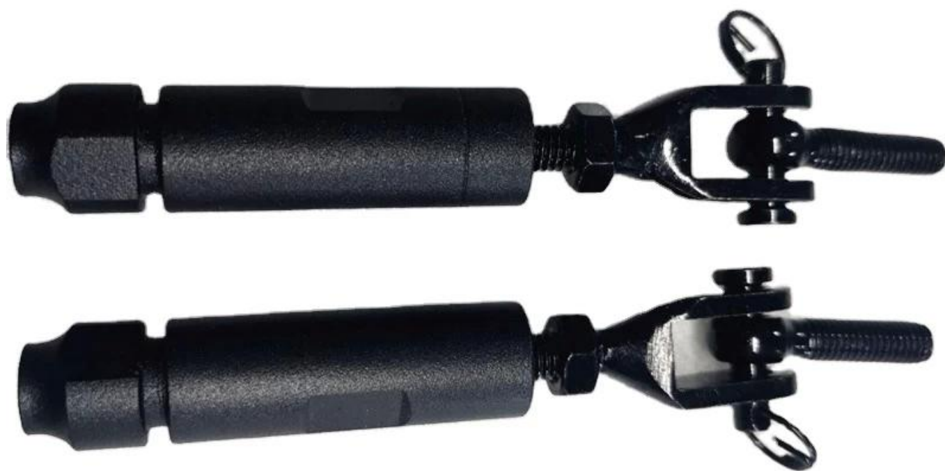
Foto del progetto della ringhiera del cavo dell'acciaio inossidabile-